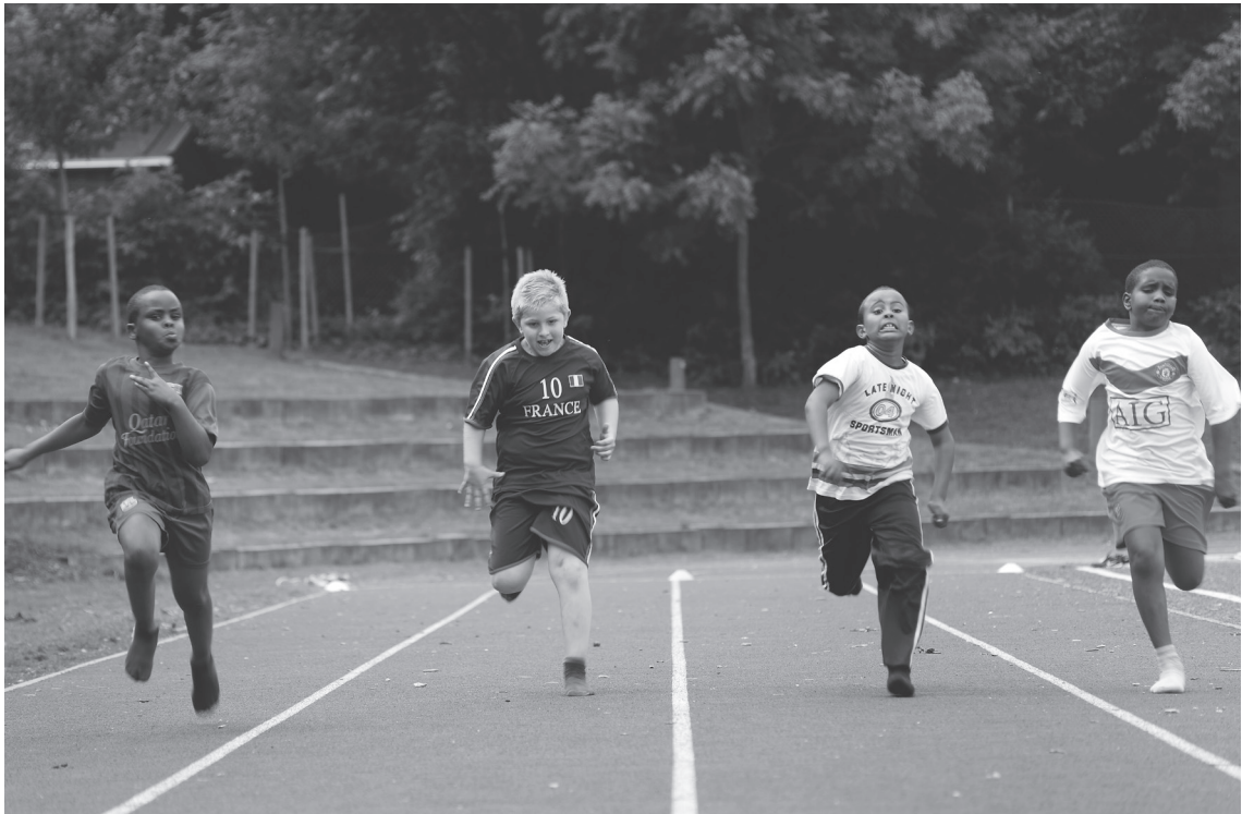
En svensk undersøgelse viser, at drenge profiterer så meget af daglig skoleidræt, at de kan opnå resultater, der er sammenlignelige med pigernes.

En av Engströms praktiker, och som också tillskrevs särskild betydelse, var “tävling och rangordning”, eftersom denna praktik dominerade den föreningsbaserade barn- och ungdomsidrotten. Om relationen mellan praktikerna “tävling och rangordning” och “lek och rekreation” konstaterades helt kort att “rangordning och konkurrens är viktigare ingredienser i den moderna tävlingsidrotten än lekmomentet”. (Engström 1999, s. 26) Den teoretiska utgångspunkten innebär att praktiken “tävling och rangordning”, barn och ungdomsårens dominerade praktik, spelar en viktig roll också för vuxenlivets idrottande då