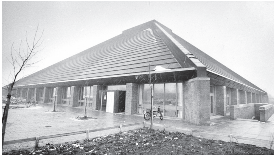
Greve Svømmehal med sin pyramideform blev i 1978 praktisk placeret ved siden af Greve midtby center og Greve station. Kommunen havde også tænkt på energiforbruget, hvorfor taget var forsynet med solceller, der skulle producere strøm til svømmehallen.