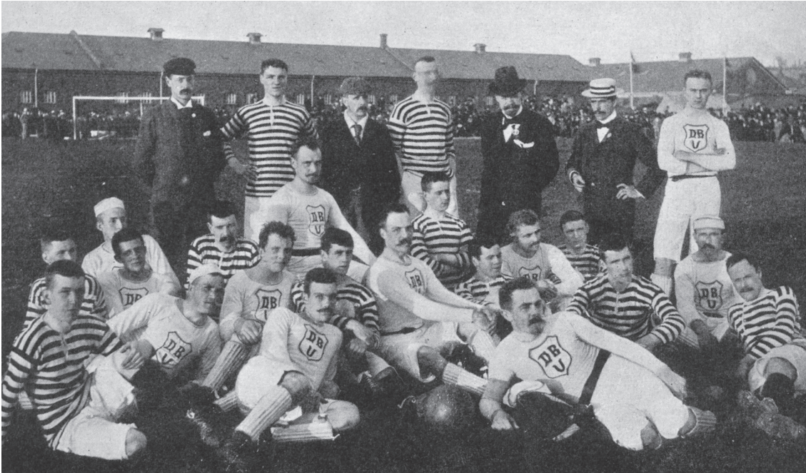
Dansk fodbold tog form i slutningen af 1800-tallet med spredte initiativer fordelt over hele landet. 21 sjællandske og fem jyske klubber oprettede i 1889 Dansk Boldspil Union, og et hovedformål med skabelsen af DBU var at skabe bedre vilkår for fodboldspillet. Med andre ord at gøre opmærksom på fodboldens sag i forhold til politikere. Her ses et udvalgt DBU-hold mod skotske Queens Park i 1898.