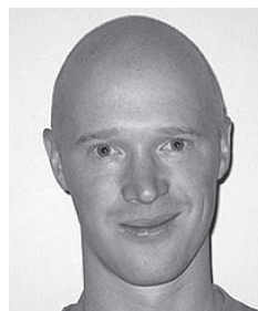
AF PER APOLLO

I det tidlige 19. århundrede skete der et skift i synet på sundhed. Sundhed blev snævert forbundet med vigtigheden af produktive arbejdere. Syge arbejdere var dårligt for økonomien, og sundhedspolitik var endemiske sygdomme og erhvervshygiejne i fokus. På den måde blev offentlighedens sundhed et vigtigt mål for politisk magt. I denne sammenhæng blev Frankrig opfattet som et foregangsland, hvor det medicinske blik penetrerede alle aspekter af samfundet og krævede kliniske optegnelser af alle egen-