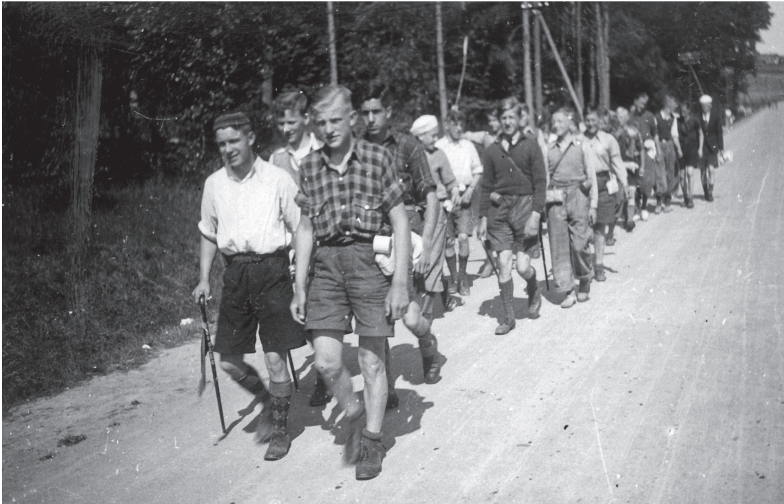
Raske drenge på vandring i 1930'ernes Danmark.