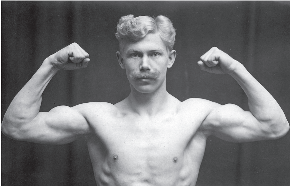
Sundhedens mange ansigter og former.