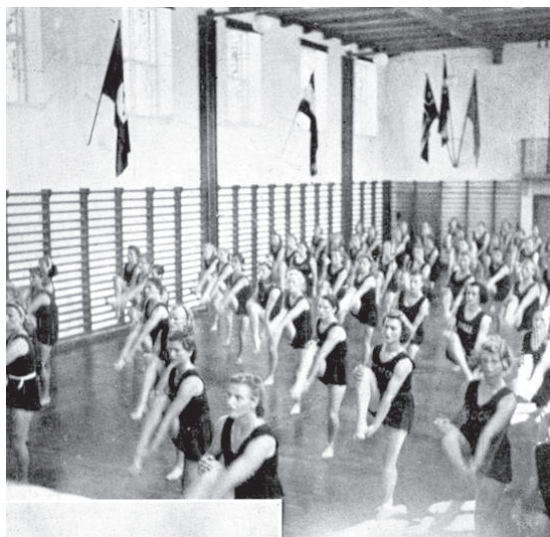
For den tyske interviewer var det glædeligt, at hagekorsbaneret (t.v.) havde en prominent placering i Bukhs gymnastiksal (Kopenhagener Soldatenzeitschrift, 20/7, 1941).

stenschiold aftalte med Krigsministeriet, at de mange indkaldte værnepligtige kunne få orlov til stævner i indland og navnlig i udland.