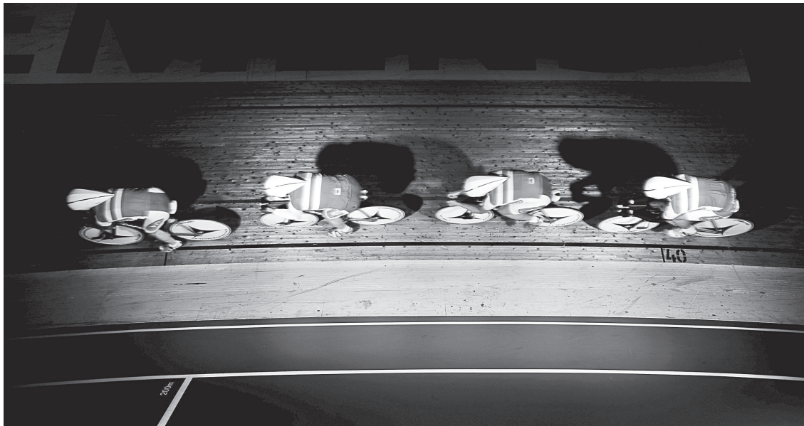
Banecykelholdet ved træningen forud for de Olympiske Lege 2008 i Beijing.