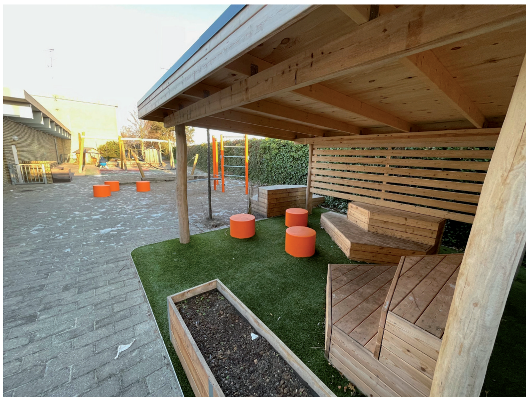
Billede 3: Tårnbygårdsskolens nye udendørs siddemøbel