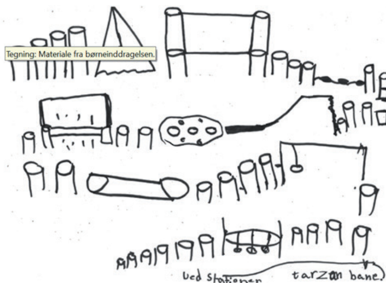
Billede 1: Børnetegning fra inddragelsesprocessen på Lyshøjskolen

Projektet og opgaven blev præsenteret åbent for børnene med spørgsmålet: Hvad kunne I tænke jer på området? Der kom mange ideer, hvoraf nogle var mere eller mindre umulige at realisere inden for projektets rammer – for eksempel et ønske om en svømmehal.