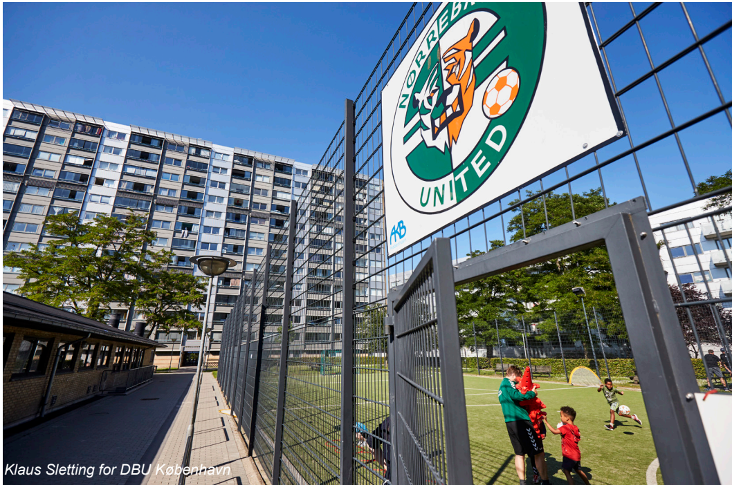
Klaus Sletting for DBU København