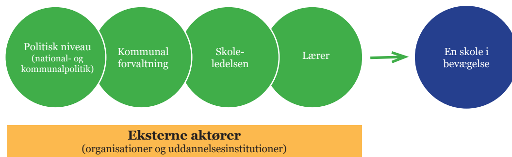
Figur 3 er en illustration af den ideelle virkekæde, hvor de forskellige aktører hver især aktivt understøtter bevægelse i den faglige undervisning.

Indeværende undersøgelse påpeger, at lærernes handlemuligheder på bevægelsesområdet bliver begrænset af manglende incitament fra både ledelsen og kommunens side, og der frembringes således en viden om, at begge aktører til tider udviser en manglende erkendelse af, at de bærer en del af implementeringsansvaret. Undersøgelsen gør opmærksom på, at de enkelte aktører i virkekæden, herunder kommunen, aktivt kan understøtte bevægelsesvejledernes praksis, for at bevægelse i skolen lykkes. Bevægelse i skolen kræver nemlig kollektiv handling - en fælles plan og redskaber til, hvordan lovkravet kan omsættes og løses på forskellige niveauer (Koch et al., 2020, s.48). I overensstemmelse med DIF, DGI og Dansk Skoleidræts (Kristensen et al., 2022a) udlægning argumenterer jeg for, at det er vigtigt, at bevægelse i skolen fortsat er underlagt konkret lovgivning - og endnu bedre, understøttes med supplerende lokalpolitisk lovgivning, da dette kan skabe