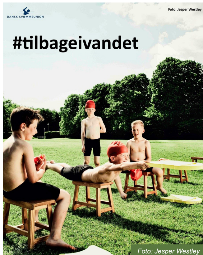
Figur 4. Dansk Svømmeunions kampagne

Sideløbende med den parlamentariske strategi iværksatte Dansk Svømmeunion en kampagne på de sociale medier under hashtagget #tilbageivandet (Dansk Svømmeunion, 2020c). I kampagnen benyttede Dansk Svømmeunion bl.a. et billede, der viser børn, der udøver tørsvømning på en græsplæne (figur 4).