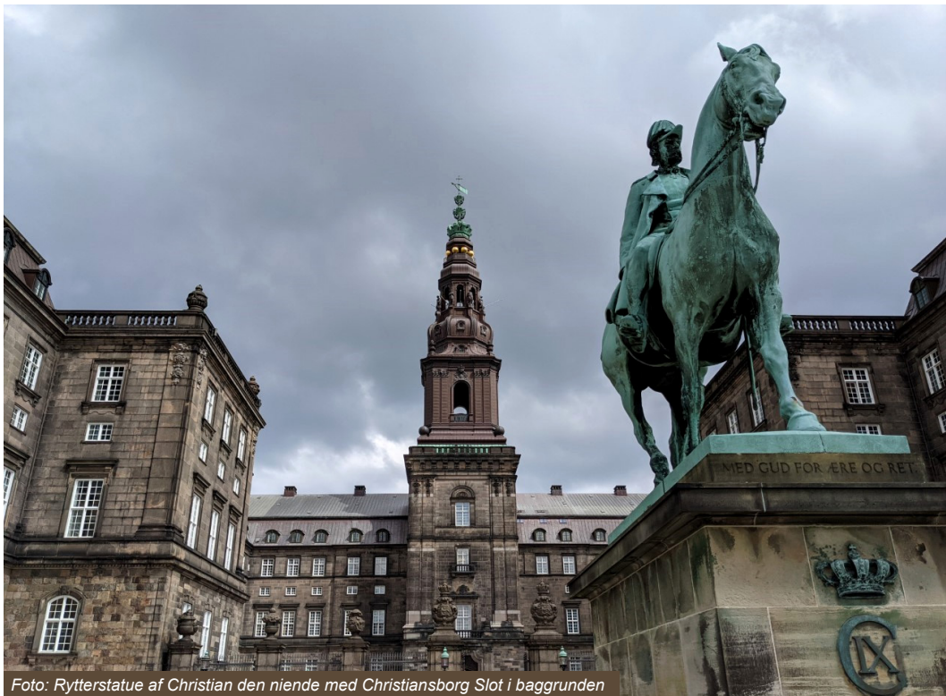
Foto: Rytterstatue af Christian den niende med Christiansborg Slot i baggrunden