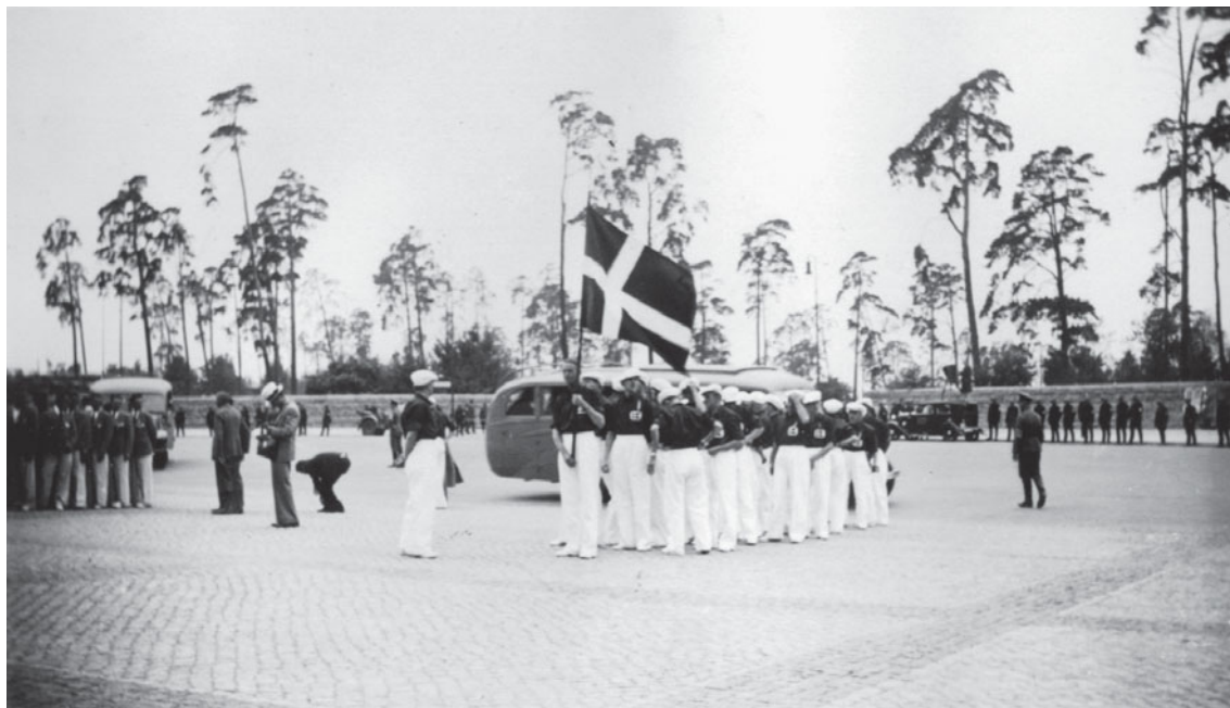
Det danske OL-hold der gør klar til indmarchen på det Olympiske Stadion i Berlin 1936.

Højdepunktet for det tysk-nordiske sportsamarbejde før krigen blev gymnastikfesten Lingiaden med 37 deltagerlande i Stockholm i sommeren 1939. De tyske og nordiske deltagere dominerede, og tysk sport fik sin første udenrigspolitiske succes i arbejdet for et tæt forhold til Norden (Bernett & Teichler, 1979, s. 99). Presen herfra er et centralt eksempel på, at de tyske sportspolitikeres indstilling til det nordiske