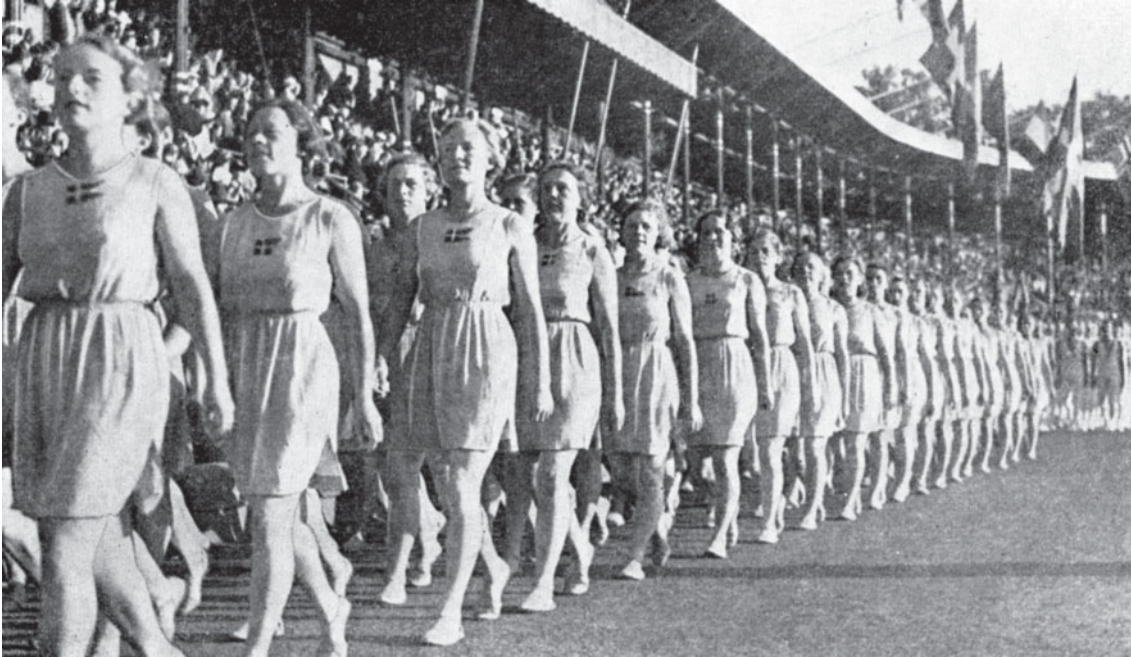
Billeder fra den danske indmarch ved Lingjaden i Stockholm i 1939.