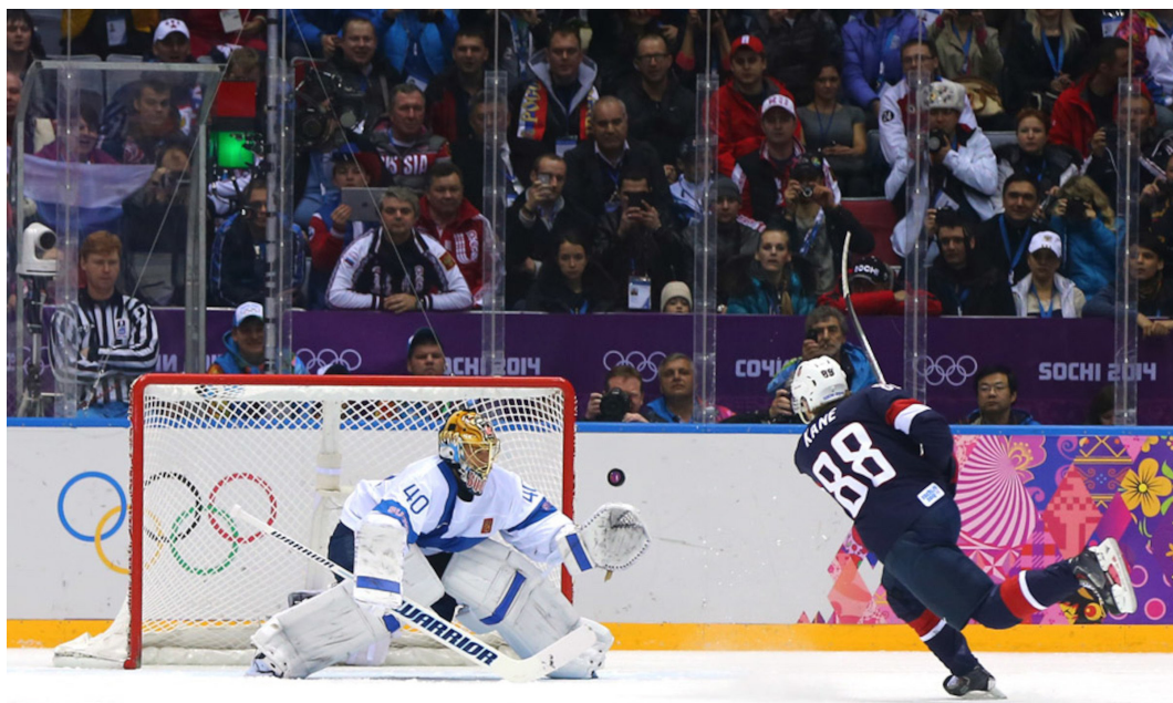
Finland vinder bronzemedalje i mændenes ishockeyturnering ved OL 2014 ved at besejre USA med 5-0 efter storspil af målmanden Tuukka Rask.

I Finland har den nationale olympiske komite igennem årtier været den centrale eliteidrætsorganisation, men overlappende strukturer i eliteidrætsorganisationer og politiske interesser på tværs af regioner har gjort det vanskeligt at udnytte de sportslige ressourcer og potentialer på en optimal måde. Finland har i forhold til de øvrige nationer i Norden bl.a. mange meget veludstyrede sports- og træningscentre fordelt over hele landet, men begrænset koordination af mål, strategier og ressourcer mellem de enkelte regionale centre. Derudover har der ofte været et dårligt samarbejde mellem klubber og forbund på lokalt og regionalt niveau i forhold til specialforbund og Suomen Olympiakomitea på nationalt niveau. Desuden blev finsk elitesport ramt af en stor doping-skandale i forbindelse med VM 2001 i de nordiske skidiscipliner – en skandale, som betød at finsk elitesport tabte både penge, prestige og status, såvel blandt politikere, kommercielle partnere og ikke mindst befolkningen i Finland. De største udfordringer for finsk eliteidræt siden årtusindskiftet har været en uklar rolle- og ansvarsfordeling og manglende koordination og ledelse af finsk eliteidræt. På den baggrund etablerede Suomen Olympia-