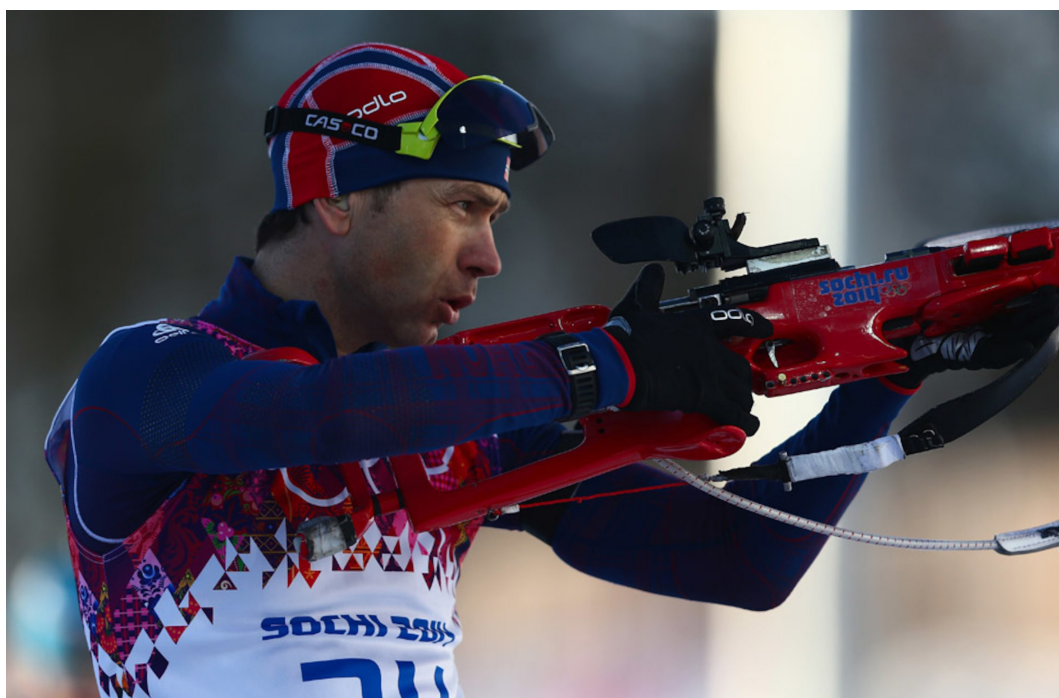
Norges Ole Einar Bjørndalen vinder OL-guld i 10 km sprint i 2014 og bliver hermed den mest vindende mandlige atlet ved vinter-OL med i alt 13 medaljer: 8 guld-, 4 sølv- og en bronzemedalje fordelt på 5 olympiske lege.

Norge vandt i alt 29 OL-medaljer i 6 forskellige sportsgrene: Langrend, skiskydning, nordisk kombineret, alpint skiløb, snow board og skihop. Resultatet betød, at Norge blev vinder af nationskonkurrencen ved OL 2014 – efterfulgt af stærke vintersportsnationer som USA med 30 OL-medaljer, men ”kun” 9 af guld, Canada med 25 OL-medaljer og værtsnationen Rusland med 20 OL-medaljer. Rusland vandt egentligt 33 medaljer under legene, men er efterfølgende blevet frataget hele 13 OL-medaljer på grund af doping. De 29 norske OL-medaljer var seks OL-medaljer flere end Vancouver 2010 og ét af de højeste antal medaljer nogen sinde. De største norske OL-profiler i Sotji var Marit Bjørgen (langrend) med 3 guldmedaljer og Ole Einar Bjørndalen (skiskydning) med 2 guldmedaljer.