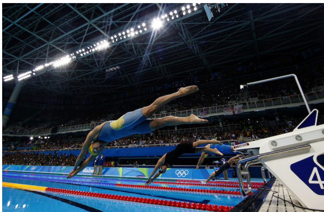
Sara Sjöström var en af Sveriges største atlet-profiler ved OL 2016 med 3 medaljer: OL-guld i 100 meter butterfly efterfulgt af OL-sølv i 200 fri stil og OL-bronze i 100 meter fri stil.

Sverige med et befolkningstal på 9,6 mio. var i første halvdel af det 20. århundrede én af verdens bedste sportsnationer, idet kun USA og Storbritannien vandt flere medaljer end Sverige ved samtlige sommer-OL før 2. verdenskrig 14 . I begyndelsen af 1960'erne, hvor Sovjetunionen og en række østeuropæiske nationer blev mere og mere dominerede gennem "statsamatørisme" og udbredt brug af doping, faldt antallet af medaljer til Sverige ved sommer-OL markant. Sverige er imidlertid stadig i dag nr. 10 på ranglisten over samtlige sommer-OL og dermed historisk den nation i verden, der har klaret sig bedst ved sommer-OL i forhold til nationens befolkningstal. På tilsvarende vis er Finland stadig nr. 14 på ranglisten af historisk bedste nationer ved samtlige sommer-OL, selv om Finland kun vandt en enkelt bronzemedalje ved det seneste OL i Rio. Sverige har også historisk været en meget stærk nation i sportsgrene som fodbold for kvinder og mænd (VM-sølv i 1958 og VM-bronze i 1994), håndbold for mænd (VM-guld i 1954, 1958, 1990 og 1999 samt OL-sølv i 1992, 1996, 2000 og 2012), tennis og golf – altså sportsgrene, som først i de seneste tiår er kommet på det olympiske program. Sverige har indtil dato vundet i alt 493 medaljer (145 guld-, 170 sølv- og 178 bronzemedaljer) ved sommer-OL i 24 forskellige sportsgrene, flest i brydning, atletik og skydning.