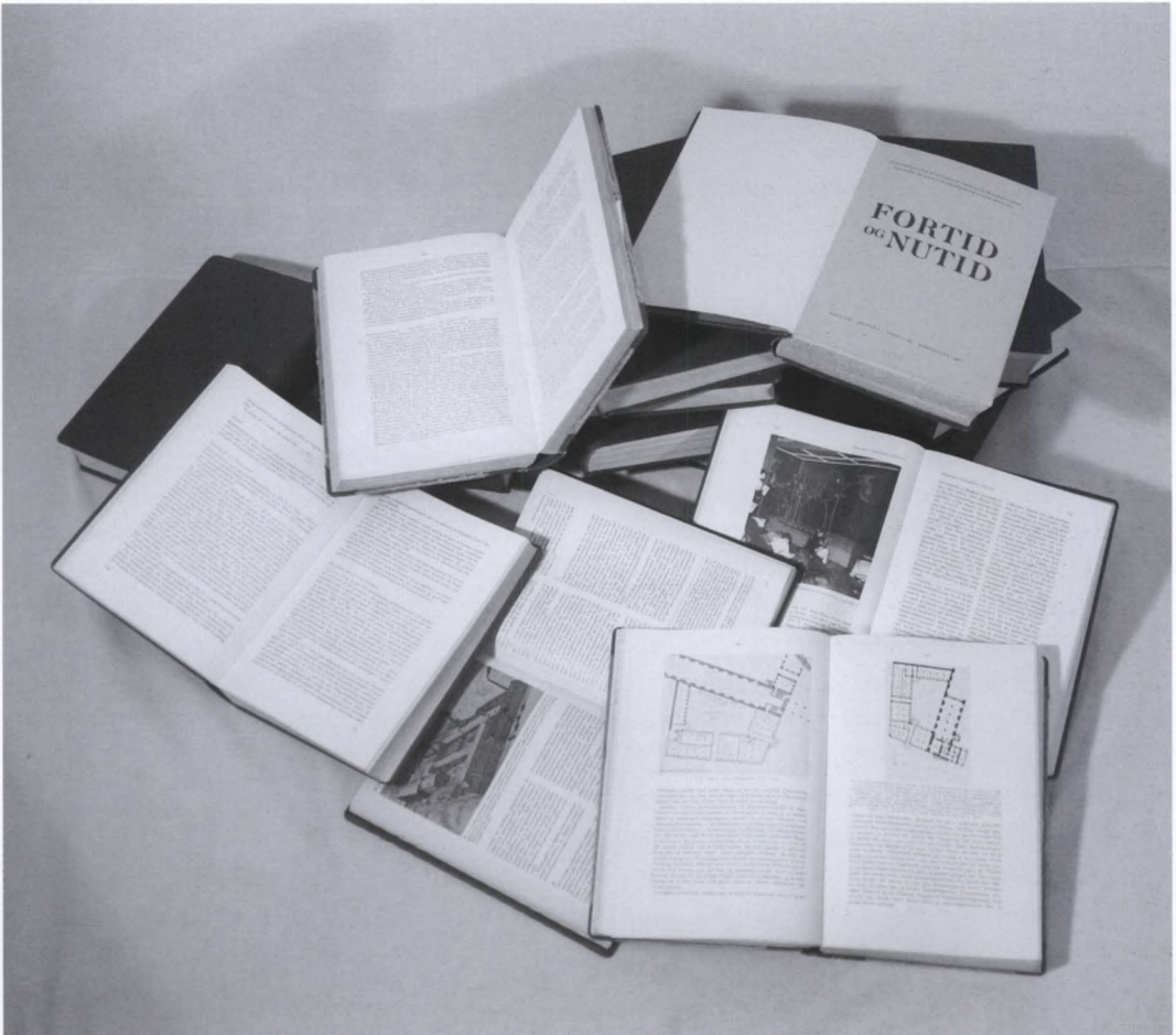
Fig. 3. Fortid og Nutid 1949-1990.