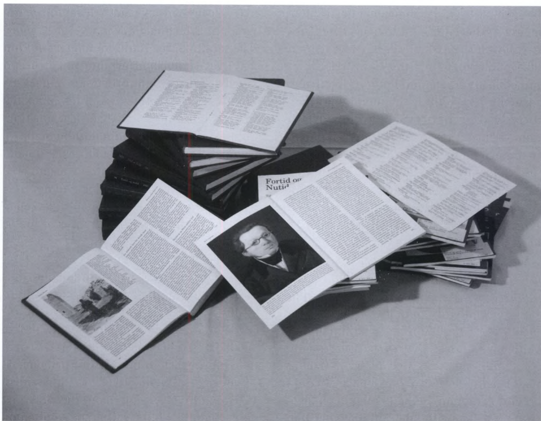
Fig. 4. Fortid og Nutid 1990-2009.