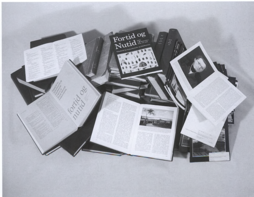
Fig. 5. Fortid og Nutid 1914-2009.

løsningen af historiens praktiske problemer. Også Fortid og Nutid havde i mange år denne ambition, men har efterhånden skiftet status fra redskab for historien til et selvstændigt udtryk for kulturhistorien i Danmark – en status der sandsynligvis vil blive yderligere forstærket med sammenlægningen med Folk og Kultur i et nyt kulturhistorisk tidsskrift.