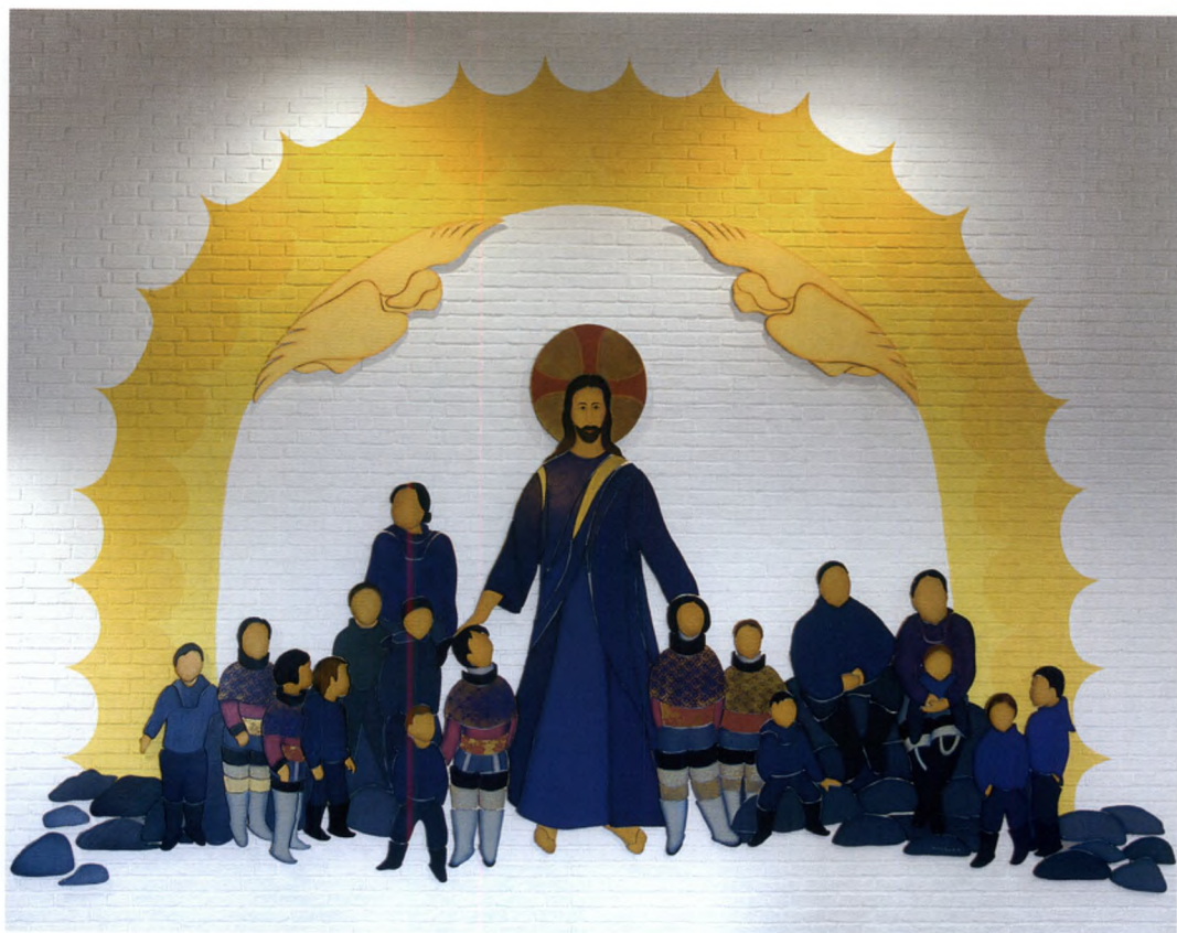
Fig. 8. Kistat Lund: Jesus og børnene. Airbrush på træ, akryl på mur. 383 x 588 cm. 1996. Gertrud Rasch Kirke, Qaqortoq.

sin lange rejse over Polarhavet er stillet med bunden i vejret på et isbjørneskind (fig. 7). Alteret af hvalbarder kommer fra de hvaler, der ligesom kristendommen rejser hele verden rundt. Øverst i loftet en frise med vandrende fugle, symboliserende livets gang, desuden en nattehimmel med stjerner på, hvor hver enkelt af byens beboere har fået lov til at male sin egen stjerne. Det er kristendommen som del af den grønlandske natur, det er landskabet og folket som del af den kristne fortælling. Der er ingen brud, der er ingen tvivl. Og herved er det blevet, hvad kirkekunst angår. Da Gertrud Rasch Kirke i Qaqortoq 1996 skulle ud-