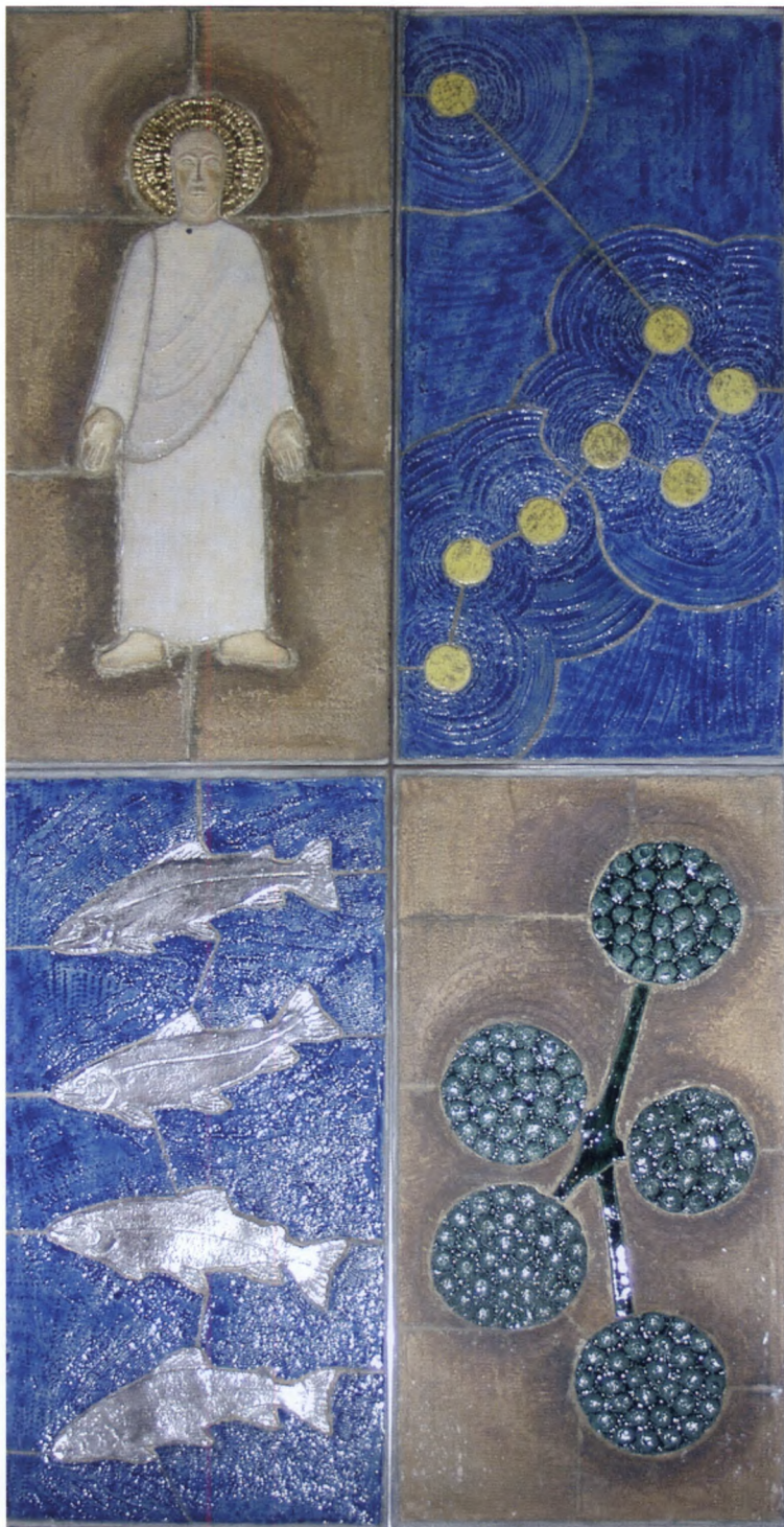
Fig. 2. Jens Rosing: Skaberen og skabningen. Brændt glaseret keramik (stentøj) i fire felter. 230 – 115 – 5 cm. Indsat i smedejernsramme. Alterudsmykning. Egede Kirke, Asiaat.