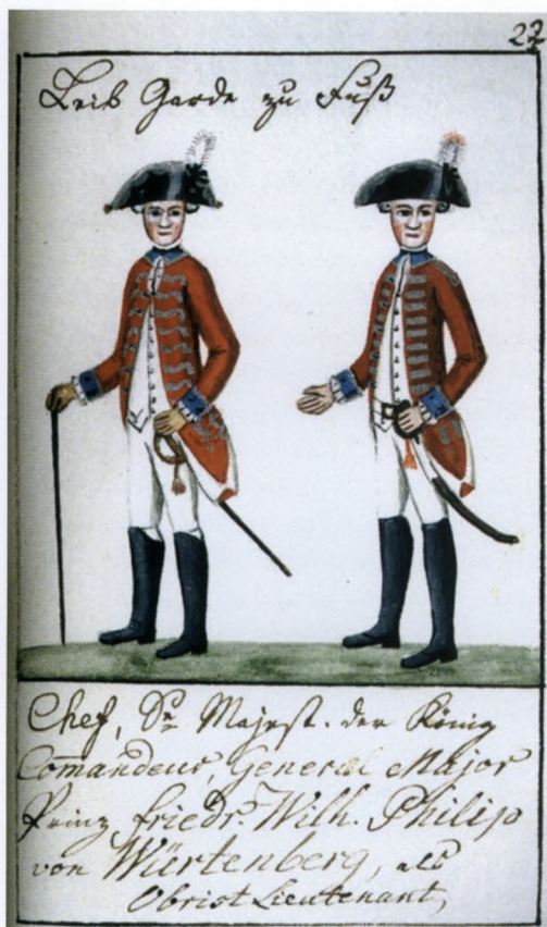
Fig. 3. To fodgardister i deres karakteristiske røde uniformsjakker. Fra "Vorstellung der Königl. Dänischen Armee, in welcher von jedem Regimente ein Officer und Gemeiner in ihrer Uniform abgebildet ist", 1787-1788.