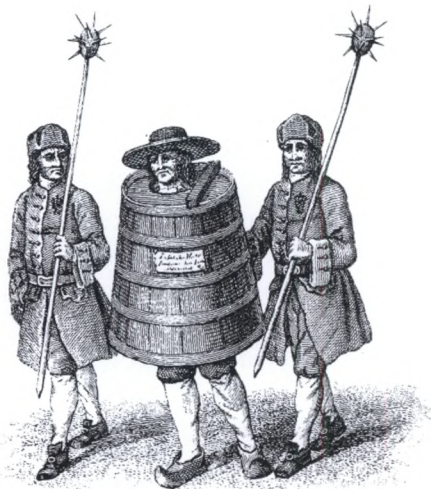
Fig. 4. En lovovertræder føres rundt i Den Spanske Kappe af to vægtere. Illustration fra John Howard: Appendix to the State of Prisons , 1784.

lidt på afstand ved kagstrygningen – den offentlige piskning af prostituerede. Arrestation af prostituerede hørte også til vægternes opgaver – på samme måde som den almindelige sædeligheds opretholdelse gjorde. Hvilket betød, at vægterne ikke sjældent måtte opbringe par, der i offentlighed havde ”legemlig Omgængelse”. 27 Det var også vægterne, der eskorterede de folk, der var dømt til at bære den spanske kappe.