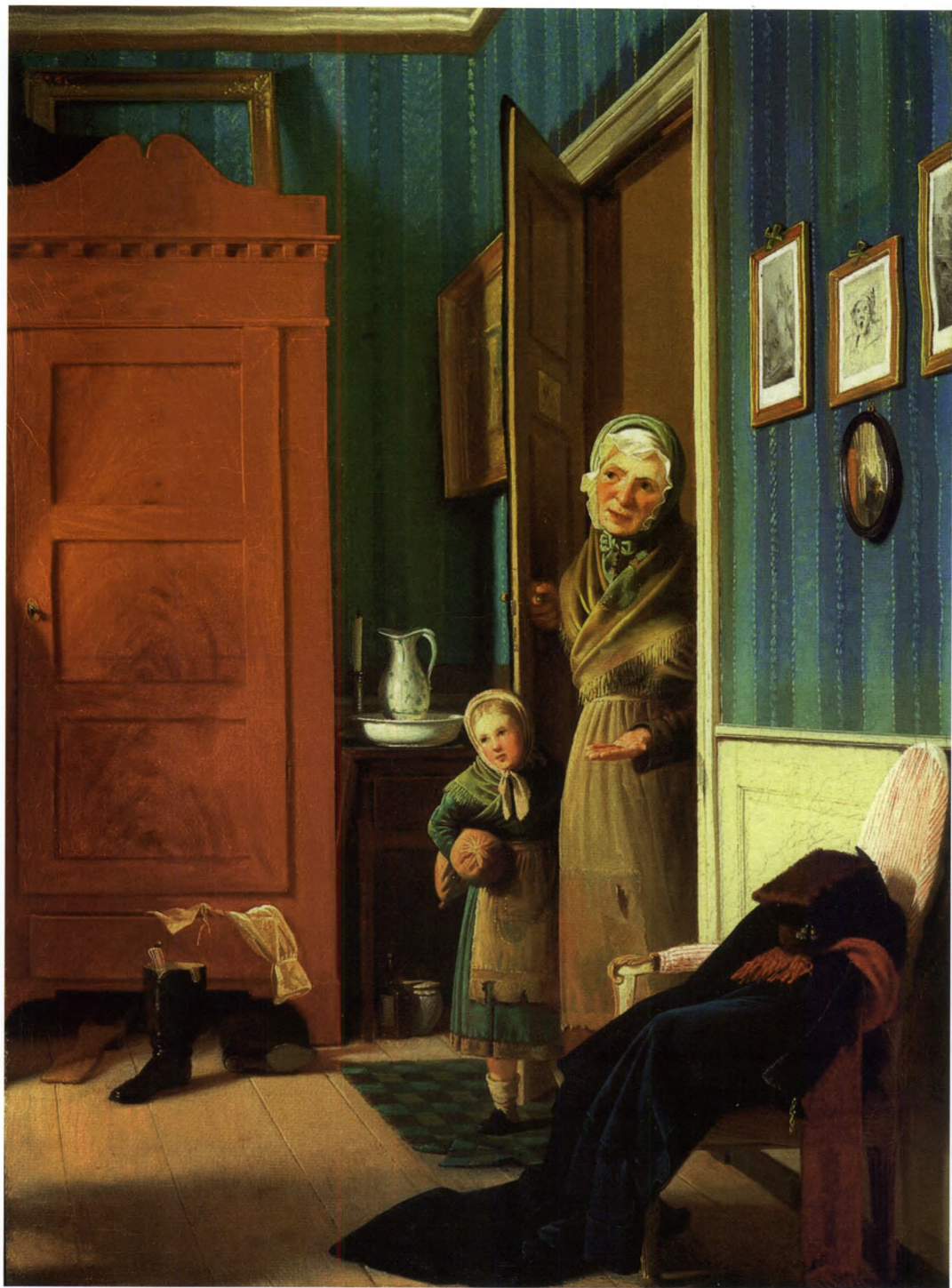
Mange tiggere gik fra dør til dør i deres søgen efter barmhjertige gaver. Her har Wilhelm Ferdinand Bendz afbildet en tiggerkone med sit barn, der har opsøgt en mulig givers hjem og betler om almisse i døren, 1829. Olie på lærred. Tidligere Matthiesen Gallery, London (2007).