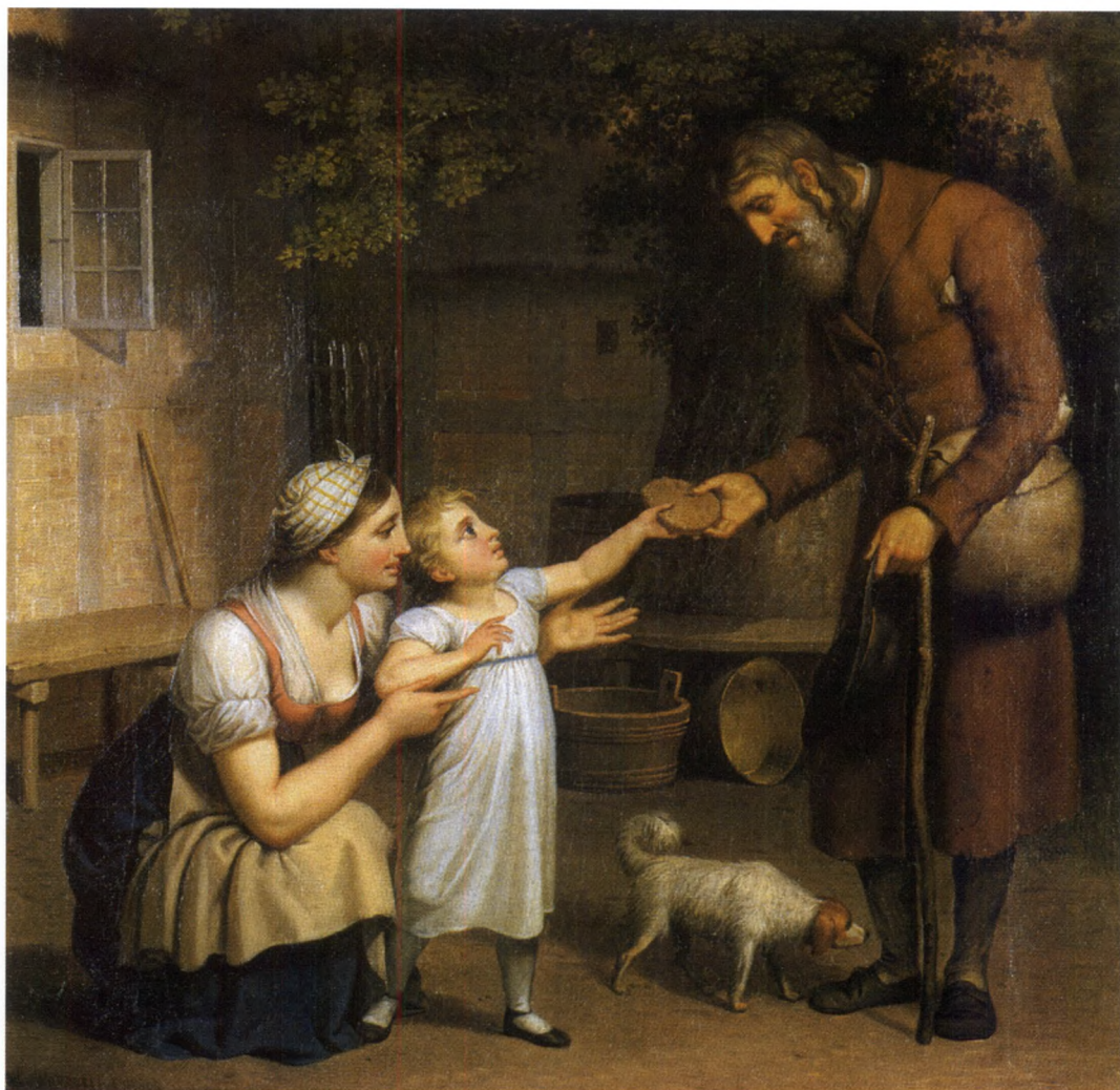
En bondekone og hendes datter giver en omvandrende tigger almisse. C. W. Eckersberg: "Tiggeren hos de gode mennesker," 1807. Olie på lærred. Jarslberg Hovedgård, Norge.