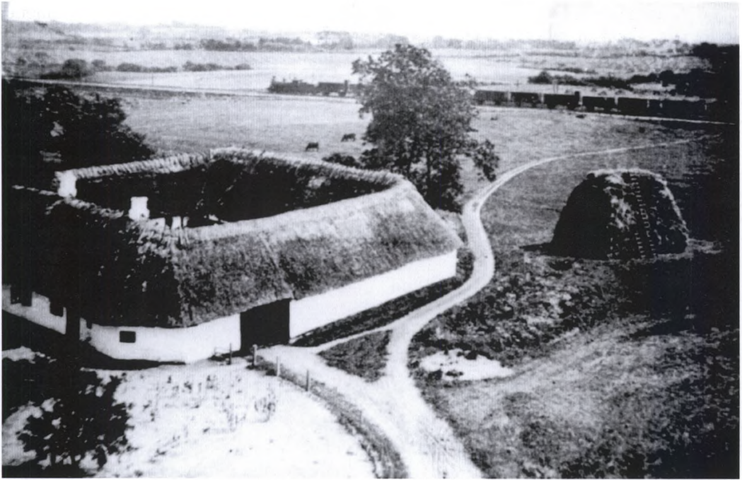
Møllegård i Render i Brylle sogn. Den typiske fynske gård i første halvdel af 1800-tallet var firelænget og opført i bindingsværk og med stråtag. Længden af fløjene afhang af jordtilliggenheden. Møllegården var en forholdsvis lille gård på ca. 3 tdr. hartkorn.

le områder, fx i dele af Tyskland, fik et sådant forløb som konsekvens, at de middelstore gårdbrug næsten forsvandt og afløstes af et stort antal meget små brug. 3) Hvis det ikke var muligt at finde en acceptabel beskæftigelse inden for landbruget, kunne man søge at få nogle af børnene etableret andetsteds – på dette tidspunkt typisk i byerne – fx ved at sikre dem en uddannelse eller blot ved at lade dem flytte ind til byen og prøve lykken der. Det var naturligvis først og fremmest en mulighed i de egne af Europa, hvor der skete en tidlig industrialisering, og først senere i 1800-tallet blev oversøisk udvandring en anden mulighed for at forlade det hjemlige landbrug.