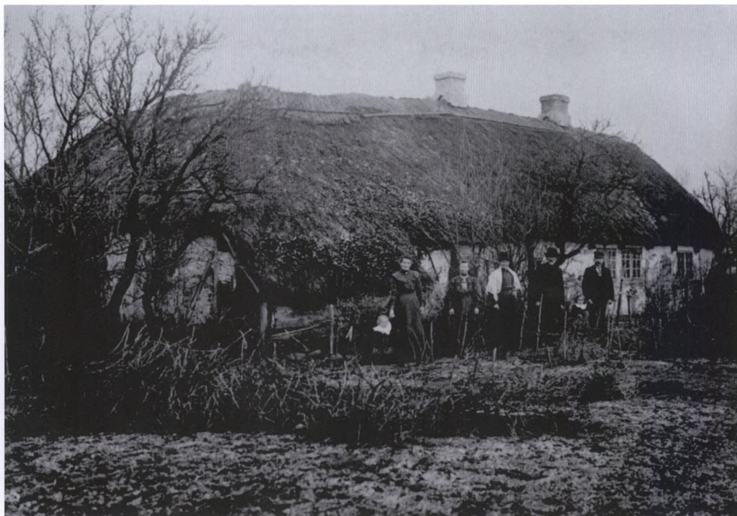
Husmandssted ved Nr. Åby. Bygningerne var en del mindre end ved Møllegården og bolstedet fra Melby. Mange fynske husmandssteder fra begyndelsen af 1800-tallet havde oprindeligt kun en beboelsesfløj og en avlsfløj, men i løbet af 1800-tallet kom der ofte flere bygninger til.

der var ugifte. Der er således intet, der tyder på, at gårdmandsbørnene har været længere om at stifte familie, fordi de har ventet på, at der skulle åbne sig en mulighed for at komme i besiddelse af en gård.