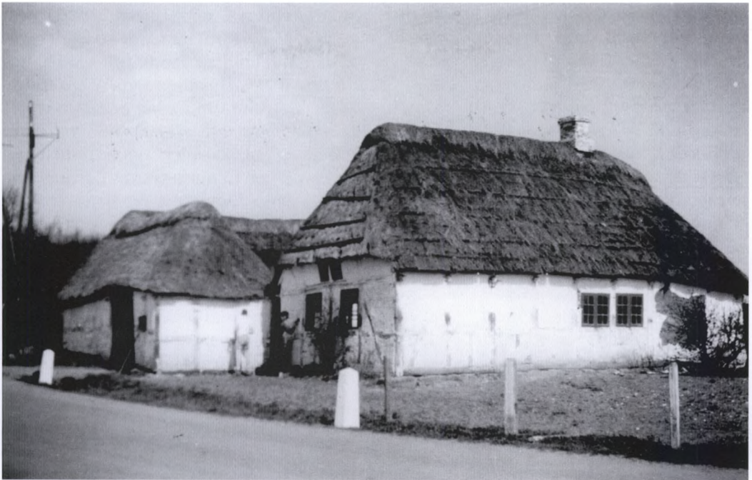
Bolsted fra Melby ved Assens fotograferet før overflytningen til Den fynske Landsby. Bolstedet blev opført med tre længer i 1822 og havde et jordtilliggende på lidt over en tønde hartkorn.