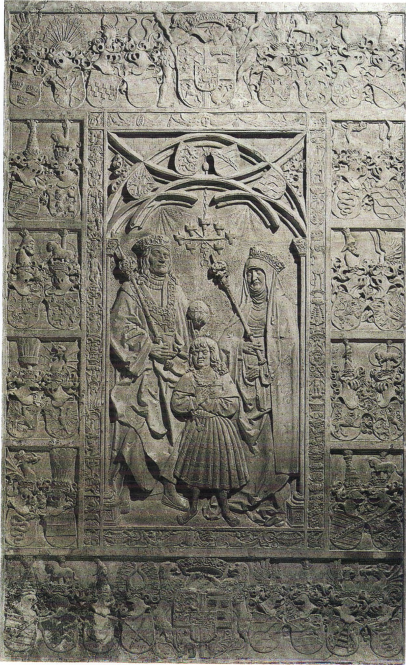
Dronning Christines ægteskab med kong Hans var langt fra gnidningsfrit. Ikke desto mindre fik hun hugget en enorm gravsten over kongen efter hans død i 1513. Mellem kong Hans og dronning Christine står parrets yngste barn prins Frans. Han var allerede død i 1511. Gravstenen tilskrives, ligesom altertavlen fra gråbrødre kirke, Claus Bergs værksted. I dag kan den ses i Skt. Knuds Kirke i Odense. (Danmarks Kirker IX. "Odense Amt" 2. bd. s.734.)