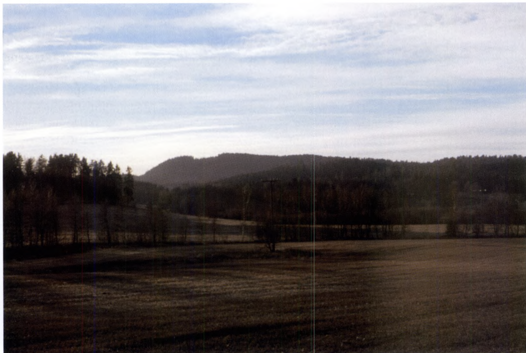
Wilse priser det "deylige landskab" i Spydeberg.

den rådende norm. Selv tyrkerne, altså muslimene, har gjort dem til sine, og i Wilses forståelse bliver dette målet for den højeste oplysning i Europa.