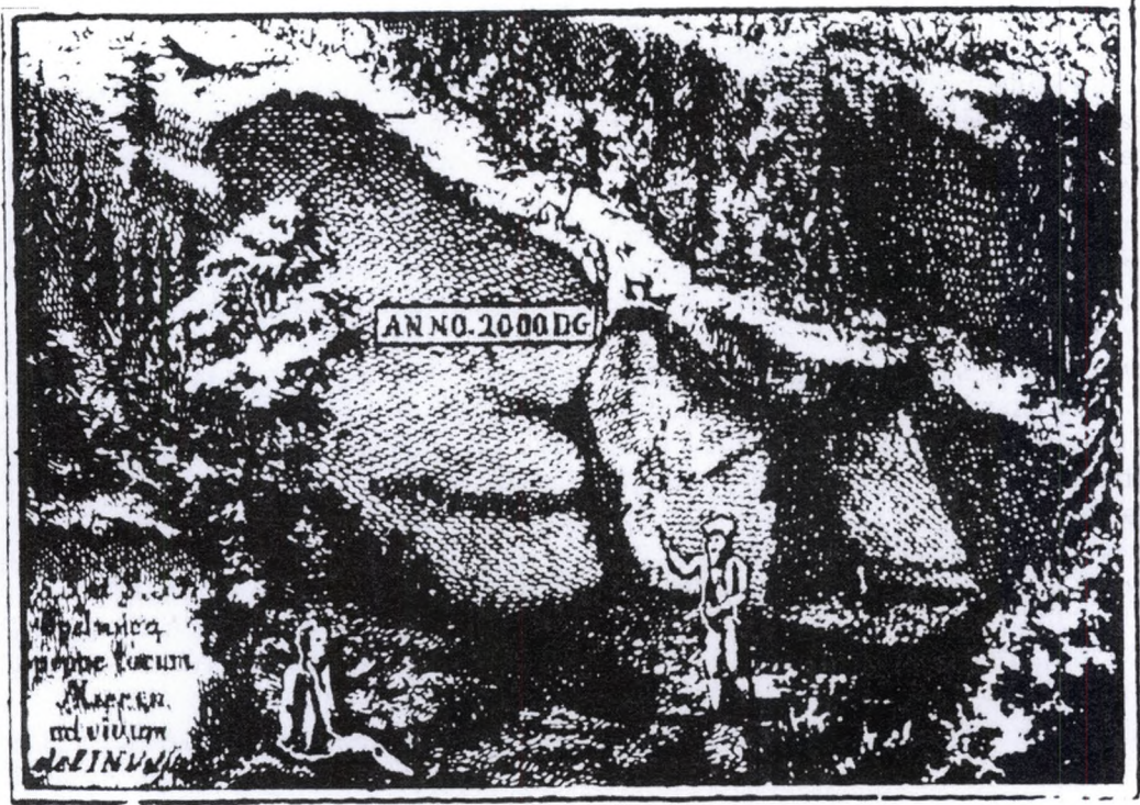
Da Philoneus vågner af søvnen, står en gammel mand udenfor hulen i Mierskovkollen og inviterer ham ind. Stik fra Wilses Spydebergbeskrivelse.

enkelte andre forfattere havde benyttet samme greb. 9 Forestillingene om en "tom" og lineær tid hører moderne mentalitet til og fik først sit egentlige gennemslag med historismens gennembrud i 1800-tallet. Da flyttede også den utopiske litteratur fra det fremmede land til den fremmede tid, til fremtiden. 10 Uden en lineær tidsforståelse er "fremtiden" slet ikke noget oplagt sted for utopiens alternative verden, og selv om ordet utopi betyder ikke-sted, er de fleste klassiske utopier skildringer af steder. En oversigt over sådanne tekster publiceret i Storbritannien i årene 1700 til 1802 viser f.eks., at kun tre af ialt 75 utopier placerer skildringen i en anden tid. 11 Flertallet skildrer i stedet fjerne lande, uopdagede øer, hændelser på månen el-