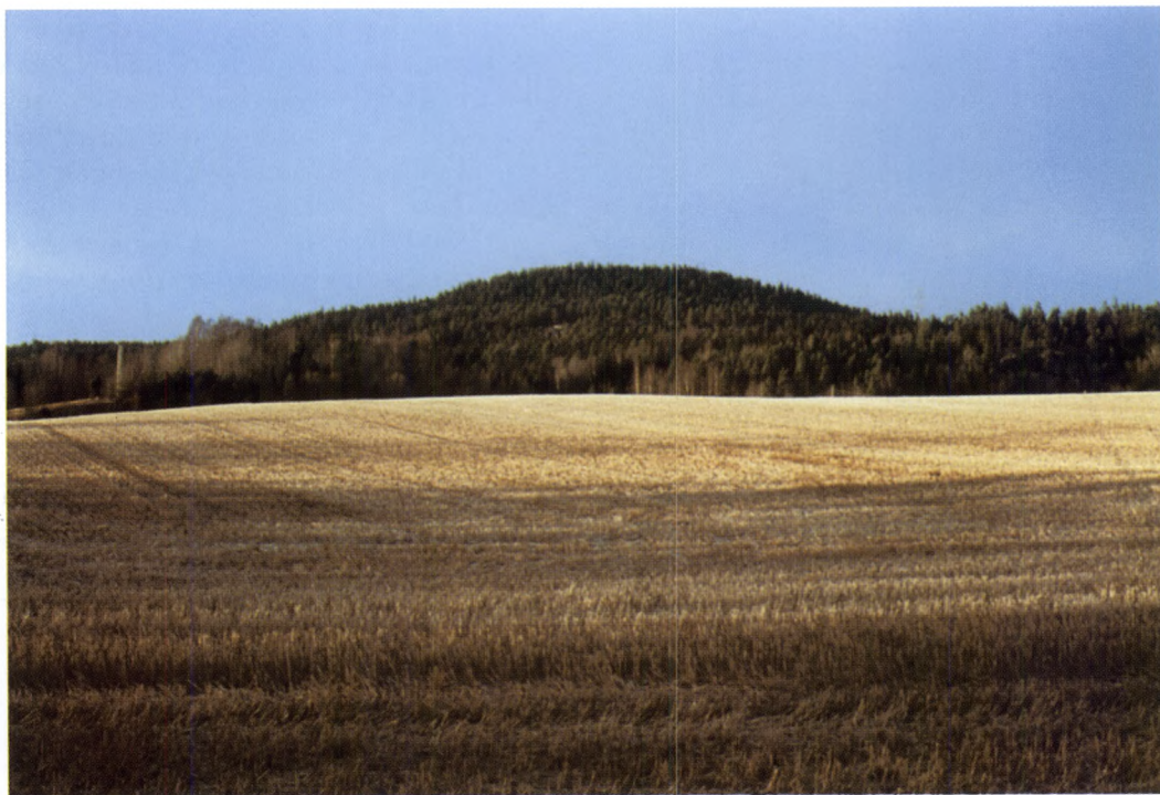
Mierskovkollen anno 2003. Forandringerne har næppe været store siden Wilses tid. Foto: S. Ubisch.

forekommer ingen dateringer, i stedet bruges formuleringer som "den tid da...". Medaljegenrens sædvanlige tilknytning til fyrstebedrifter som lovgivning og politiske beslutninger bidrager desuden til at også de begivenheder, Wilses skildrer, får præg af intenderede beslutninger og ordninger. Samtidig er der vigtige forskelle mellem Wilses skuepenge og de virkelige medaljer. Hos Wilses er fyrsten praktisk talt fraværende. I stedet fortæller han en historie, som i hovedsagen drejer sig om civilt liv og borgerlige aktører. Politik og militærvæsen var historieskrivningens egentlige temaer på Wilses tid, men hos ham skildres dette udelukkende i økonomiens og den civile nyttes termer eller som moralske spørgsmål. Flertallet af medaljerne har desuden en ren civil tematik. De drejer sig om