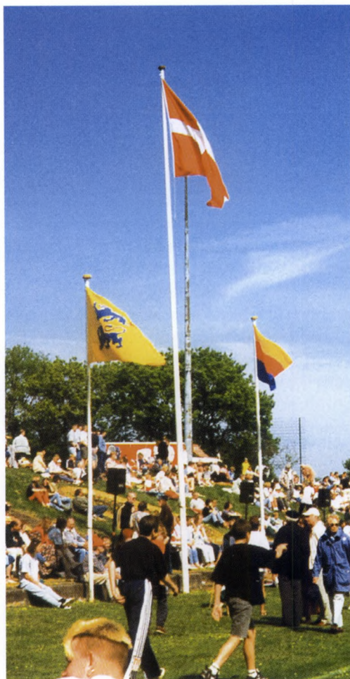
På friluftsmødet i Slesvig under De danske årsmøder i Sydslesvig i 1997 blev der flaget med Dannebrog, det sydslesvigske løveflag og det frisiske flag. Dermed blev det nationale og regionale tilhørsforhold fremhævet sammen med det danske mindretals samarbejde med friserne i Friiske Forening.

Ved ankomsten til årsmødepladsen er der ceremonielt faneindtog, og fanerne bliver stillet bag talerstolen. Så er der