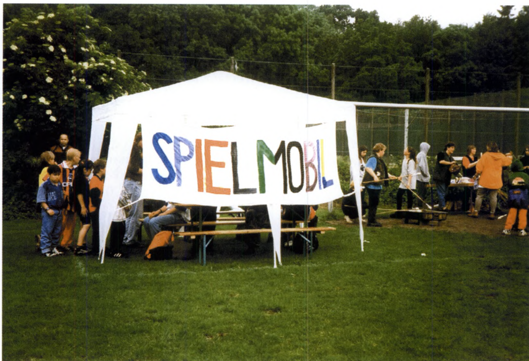
Mindretalssproget dansk er det officielle sprog ved De danske årsmøder i Sydslesvig og et af de nationale symboler. Mindretallets tosprogethed med dansk og tysk afspejler sig imidlertid også, fx med en "Spielmobil" på friluftsmødet i Flensborg i 1998.

derne. Det er ikke kun velkomsten til den officielle tyske gæst og dennes tale som er på tysk. Der er også en ligeværdig brug af dansk og tysk blandt mange deltagere, først og fremmest mellem voksne og børn.