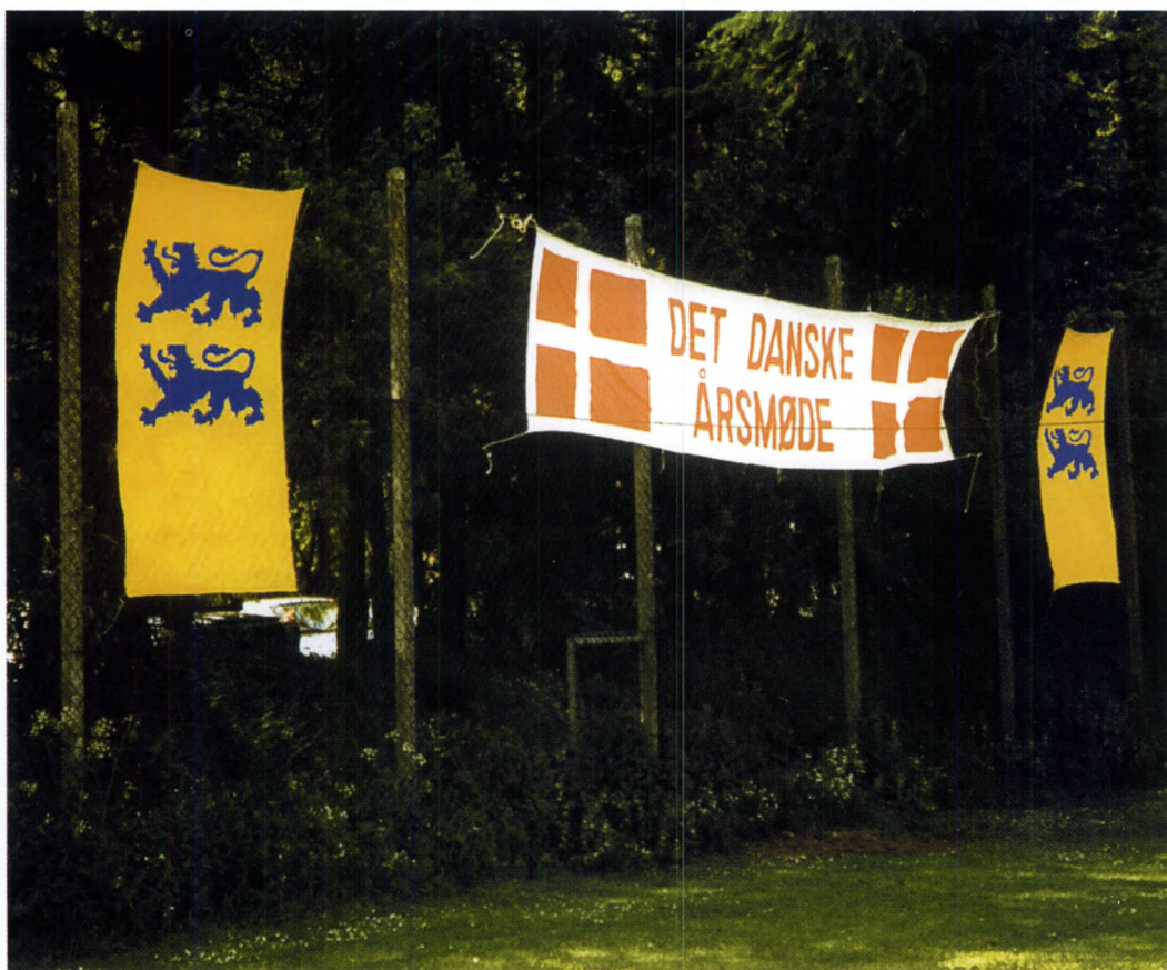
Det sydslesvigske løveflag og et banner med Dannebrog ved De danske årsmøder i Sydslesvig i Slesvig 1997.

paganda, hvilket kan gøre symbolikken noget problematisk for et mindretal i Tyskland. Men det overvindes vel af at lurterne bliver brugt som kvalitetsmærke for dansk smør, 12 og af at lurblæsning også anvendes ved officielle lejligheder i Danmark bl.a. på Rådhuset i København.