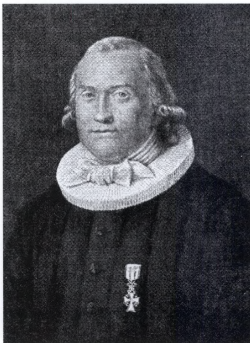
PROVST VICTOR CHRISTIAN HJORT. † 1818.

I Danmark fik industriskolebevægelsen støtte fra officiel side med den Landfabrik- og Spindeskolekommission, der i 1781 blev etableret med det formål at få iværksat spindeundervisning i landdistrikterne. Forskellige velgørende selskaber virkede for at fremme disse skoler, der blev anset for at være til gavn