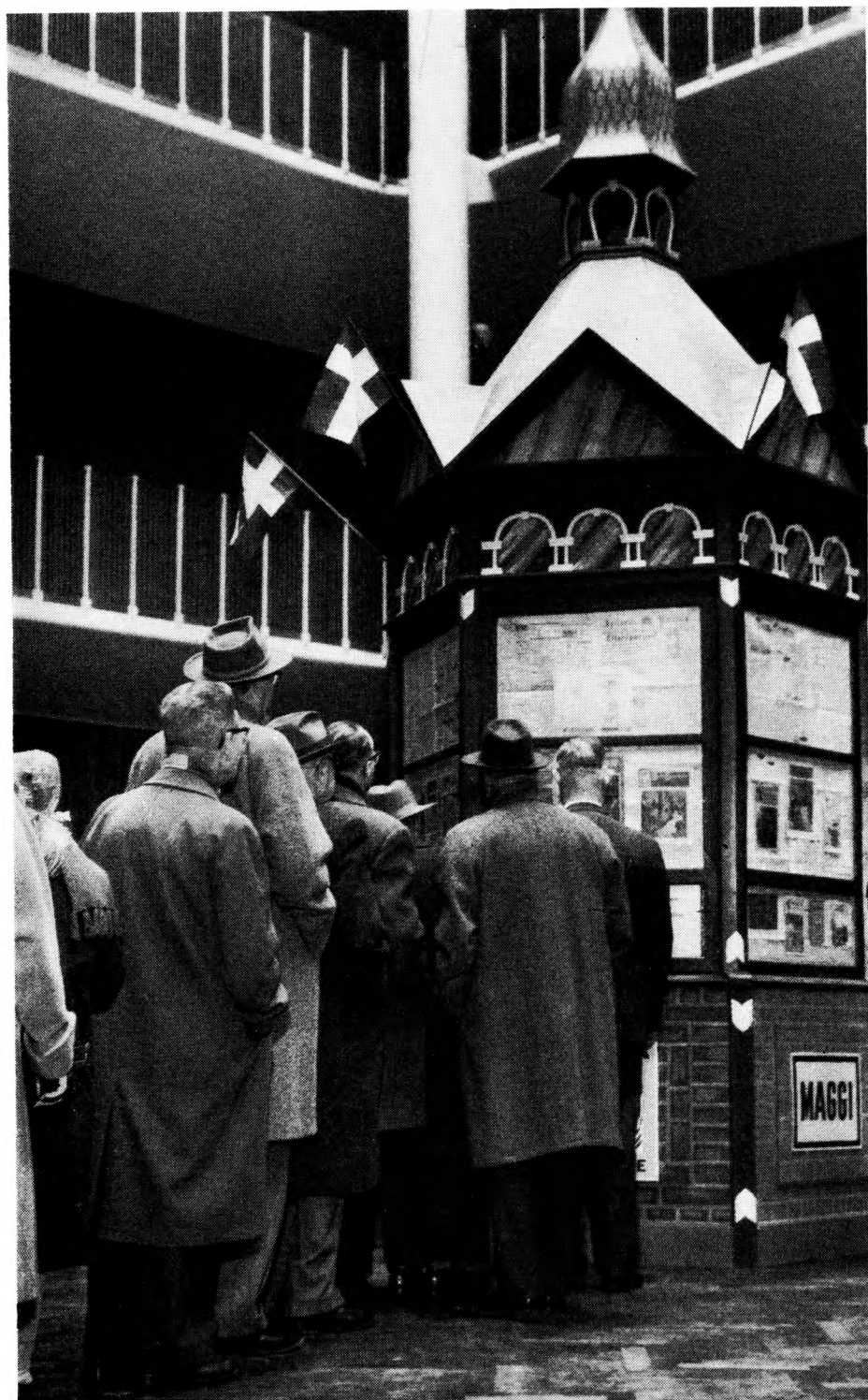
Fra indgangen til »Århus Promenade 1909-59«. Kiosken en kopi af byens kiosker fra 1909. I kiosken solgtes nyoptryk af byens aviser fra 1909 samt billetter til udstillingens biograf. I udstillingsvinduerne var bl. a. anbragt kulørte hæfter fra 1909.