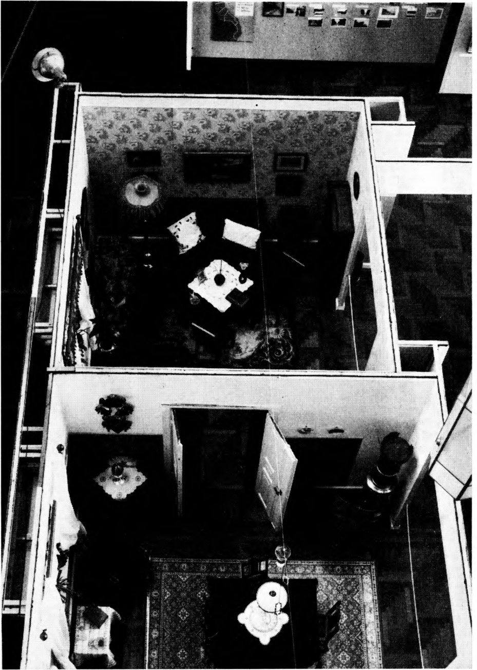
Interiører virker altid dragende. En lejlighed fra 1909 blev opstillet og monteret. Billedet viser også teknikken i vægopstillingen. Vinduer, kakkellovne og døre blev købt hos et nedbrydningsfirma.