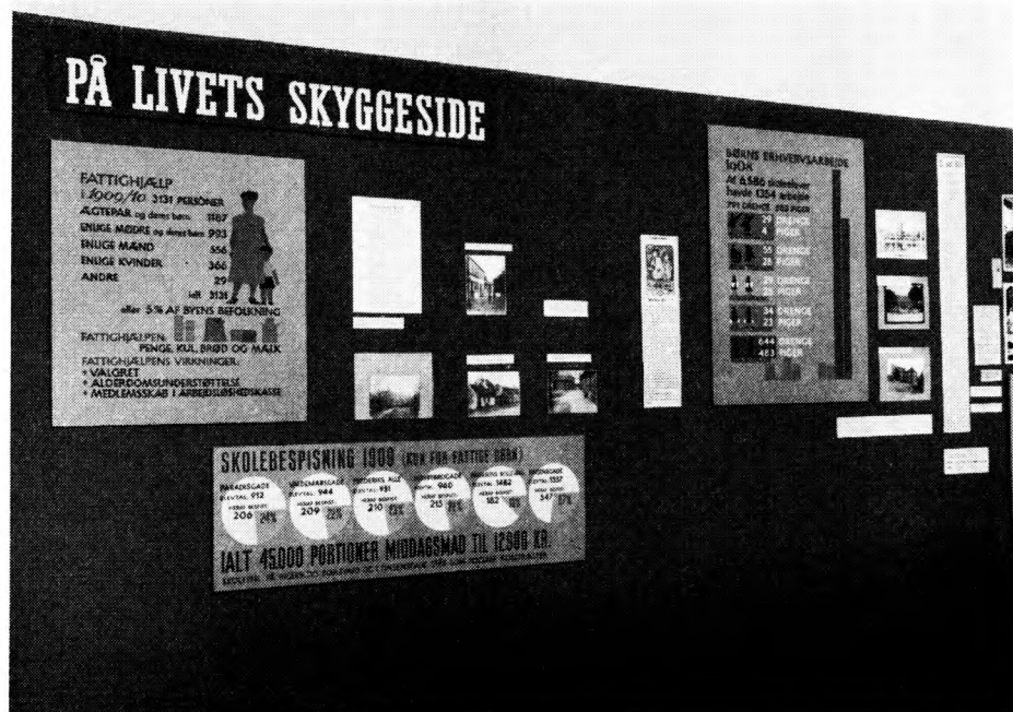
På livets skyggeside. Væggen giver et indtryk af, hvordan samtidige billeder uddybes gennem farvede tavler med tal og illustrerende figurer.