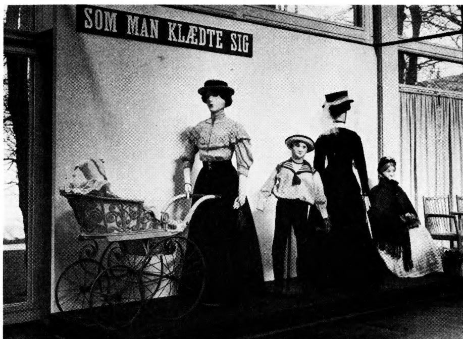
Udklædte figurer har også stort publikumstække.