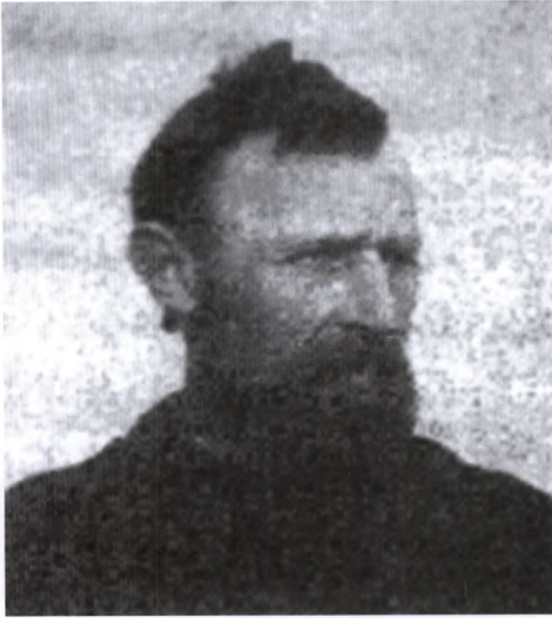
Et eksempel på Anholtformen, kropsliggørelsen af den danske urbefolkning, som med tiden ville udvikle den nordiske types karakteristiske lyse kendetegn.

den oprindelige danske race andetsteds – på øen Anholt. Øen forekom ham interessant af to grunde. Dels var beboerne på Anholt primært landbrugere og jordbesiddere, hvorimod befolkningen på andre småøer, som for eksempel Læsø og Fanø, hovedsageligt var beskæftigede i søfarten. Dels var øen Danmarks mest isolerede egn gennem tiderne, og derfor skulle “dens Befolkning opfattes som saa ublandet, som man nu kan vente at træffe det i Skandinavien” . 28 Steensbys tro på og forventninger til bondebefolkningen som repræsentant for urtypen var forblevet intakt.