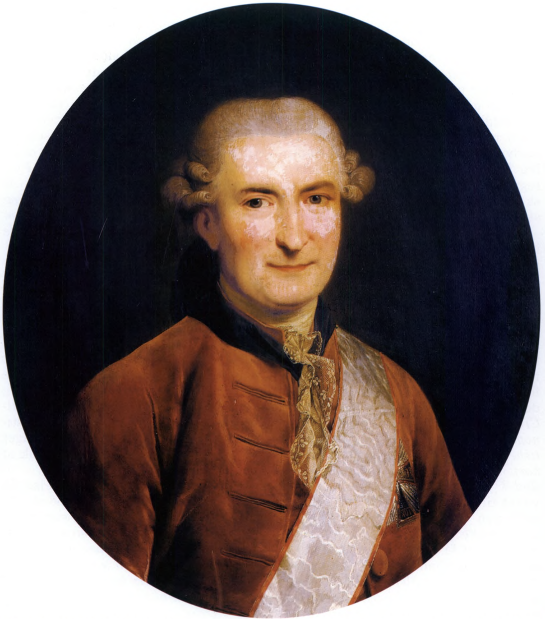
Fig. 3. Ove Høegh-Guldberg med Dannebrogordenen, portrætteret af hofmaleren Jens Juel i 1782, da Guldberg var på toppen af sin politiske karriere. Der findes ingen portrætter af Guldberg før han blev en magtfaktor ved hoffet, og portrættet her gengiver tydeligvis en betydningsfuld og selvbevidst person. Guldbergs vej mod magten gik ad forskellige omveje, men da han endelig var blevet etableret på Christiansborg, greb han chancen og formåede at holde sig ved magten indtil et kup i 1784 væltede ham (Portræt på Horsens Statsskole.).