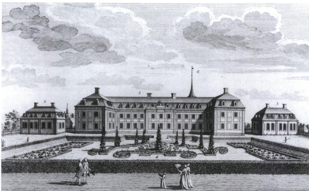
Fig. 2. Det var et foreløbigt højdepunkt i Guldbergs kometagtige karriere, da han blev udnævnt til professor i historie og veltalenhed ved Sorø Akademi. Imellem sine forelæsninger fik han tid til fordybelse, hvilket først og fremmest gav ham tid til at udvikle og formulere sine tanker om sprogets betydning for en dansk identitet. Disse tanker skulle senere blive centrale i Indfødsretsloven fra 1776. Det var imidlertid også her ved akademiet, at han kom til at opleve en personlig tragedie: Under en nytårsmiddag den 1. januar 1763 faldt hans kone pludselig død om, sandsynligvis ramt af et hjerteanfald. Hun blev kun 29 år, og parret var barnløst (Prospect af Sorøe Adelige Accademie 1755.).

om emnet: »Dog vort Sprog bør være kiert, og dets Ære hellig. Men selv foragte vi det, og overlade det næsten til Almuen. Vore fleste Fornemme fornædte sig, naar de tale det: visse som burde tale det best, tale det intet: man kunde være Dansk, og leve i Landet og af Landet, uden at forstaa Landets Sprog«. 17