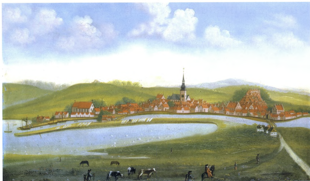
Fig. 1. Horsens var med sine mere end 2000 indbyggere blandt de ti største byer i Danmark (syvendestørste by ifølge folketællingen i 1769). Byen fik sine købstadsprivilegier i 1442, og efter et økonomisk dyk i 1600-tallet som følge af en række plyndringer i Trediveårskrigen, oplevede den opgang i 1700-tallet. Med grundlæggelsen af Horsens Latinskole i 1532, fik byen et uddannelsessted, som blev arnested for provinssønners akademiske ambitioner.

Ove Høegh-Guldberg, men hypoteserne bliver »rundbarberede«, og tilbage vil være, som nævnt, en skitse af et ambitiøst menneske, som brød med adelens fødselsrettigheder. Guldbergs egentlige politiske projekt kan bedre bedømmes ved at inddrage hans tidligere virke som teolog, videnskabsmand, debattør og lærer. Her kan der nemlig findes talrige eksempler på hans syn på moral, økonomi, og uddannelse, som kan kaste nyt lys over hans karriere som statsmand. Netop disse emner vil her blive taget op og bidrage til at placere mennesket Guldberg i et større perspektiv.