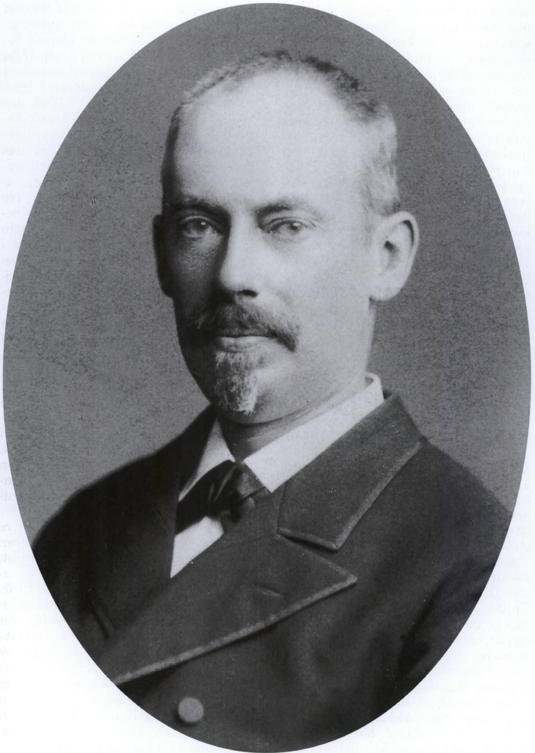
Fig. 2. Troels-Lund fotograferet i 1885. Han var da 45 år gammel og midtvejs i udarbejdelsen af hovedværket Dagligt Liv i Norden i det 16. Aarhundrede (Foto i Det kongelige Bibliotek).