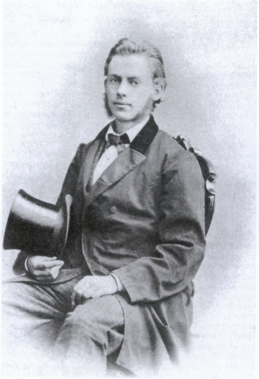
Fig. 1. Troels Frederik Troels-Lund 1840-1921. Fotografiet er formodentlig fra midten af 1850'erne, før Troels-Lund fandt sin livsbane som historiker og i den udkastede og gennemførte planen for det værk, der skulle give ham en central placering i dansk kulturhistorisk videnskab.

Søren Kierkegaard fik stor betydning for Troels-Lund, såvel menneskeligt som filosofisk. Menneskeligt gennem familietilhørsforholdet og det mere intense venskabelige forhold mellem Kierkegaard og Troels-Lund, som i hvert fald sidstnævnte følte. Filosofisk kommer betydningen til udtryk i starten og slutningen af Troels-Lunds forfatterskab: Troels-Lunds doktordispu-