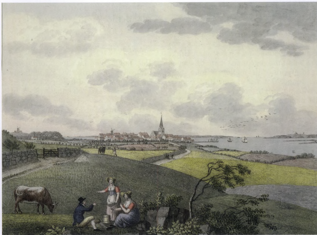
De patriotiske selskaber var lokale organer for Det kongelige danske Landhusholdningsselskabs bestræbelser på at udbrede oplysning og tekniske færdigheder blandt landalmuen. Der blev stiftet selskaber i stort set alle købstæder og egne af den dansk-norsk-tyske fællesstat. Selskabernes overordnede formål var at udbrede kærlighed til fædrelandet blandt alle landets indbyggere, således også i Rudkøbing. Koloreret radering af S.L. Lange 1820.

om hvordan samfundet burde indrettes. Det er derfor rimeligt at betegne patriotismen som en ideologi og selskaberne som en bevægelse. Samtidig samlede medlemmerne sig omkring en række uformulerede forestillinger og antagelser og var dermed et tidsbillede på nogle af den sene oplysningstids centrale ideer og strømninger. Frihed var et centralt begreb i selskabernes taler, men i lighed med periodens øvrige landboreformatoriske litteratur tilstræbte patrioterne ikke en fuldstændig liberalisering. De ønskede, at statsmagten trådte til med beskyttende foranstaltninger i takt med, at det feudalt prægede samfund afvikledes. Selskaberne holdt sig inden for ram-