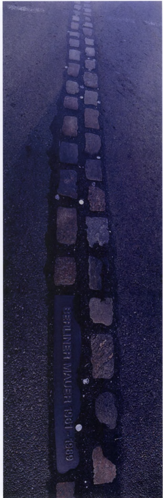
Fig. 1. Berlinmuren stod i 28 år (1961-89) som et monument over »Den kolde krig« og det delte Europa. I dag markeres murens tidligere tilstedeværelse og placering eksempelvis som her ved brosten nedlagt i asfalten.

Kommunikation er kommet i centrum. Formidlingsteknologi er blevet indbegrebet af metode. Meget opsamlet gedigen faglig viden om tingene drukner ofte i de oplevelsesæstetiske overvejelser, der oprindeligt blot skulle være en hjælper for vidensformidlingen. Men oplevelsesdimensionen tager i disse år over og er blevet den helt centrale. Man kan heldigvis ikke opleve uden også samtidig at få noget at vide, siges der. Men er det sandt? Og er det, man får at vide, når man oplever alene i kraft af oplevelsen altid sandt? Hvis ja, i hvilken forstand og udstrækning er det så sandt? Er sandheden om en ting blevet til oplevelsen af sandheden om en ting? Eller vil der altid optræde forskydninger mellem sandhedsoplevelser og selve sandheden, uanset hvordan tingen opleves? Hvis man anerkender forskydninger-