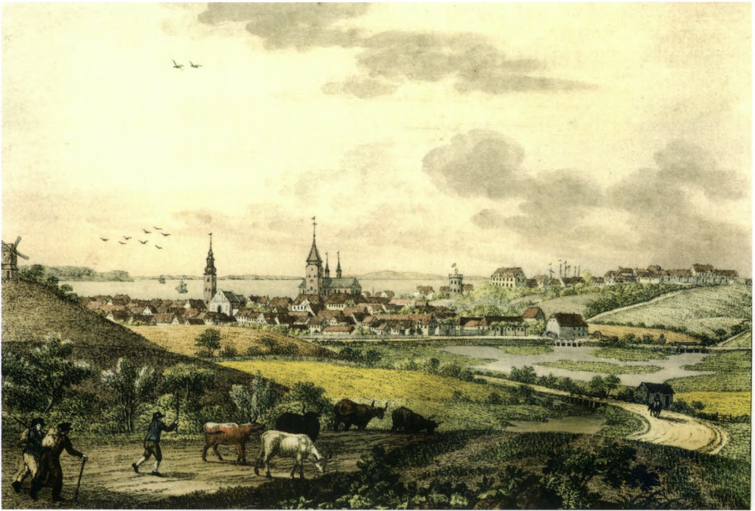
Fig. 6. Udsigt over Århus fra nord-vest omkring 1823. Kvæget drives ind til købstaden. Til venstre vindmøllen på de såkaldte Mølletøfter. I baggrunden den lille købstad omgivet af byens planker (Tegning af S. Læssøe Lange i Den gamle by, Århus ).

borgere handler lidt ved siden af andet erhverv. Fiskeriet har man på dette tidspunkt bortforpagtet, og jagt er der ingen af. 76 Til sammenligning var der 56 købmænd i Randers på samme tidspunkt. 77