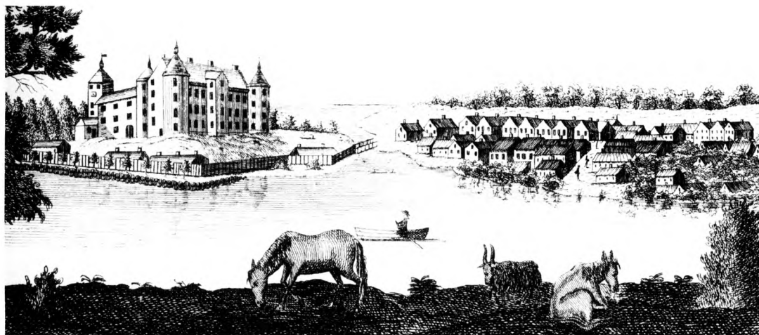
Fig. 7. Udsnit af prospekt over Skanderborg set fra sydvest med græssende dyr i forgrunden. Gengivet fra Erik Pontoppidan: Den danske Atlas bd. 3, 1768)

Størrelsen af byens særjord eller offentlige jord og dermed størrelsen af lejeindtægter og afgifter af jorderne til kæmnerkassen er tilsyneladende bestemt af en lang række mere eller mindre tilfældige faktorer. En købstad med et stort jordtilliggende har alt andet lige mere jord, som kan lejes ud til dyrkning. Indbyggerne i købstæder med gode jorder ønsker jorderne opdyrket og udskifter dem derfor på et tidligere tidspunkt i historien til grundene, men jord, der udskiftes til grundene, skifter hurtigt status fra fælles-