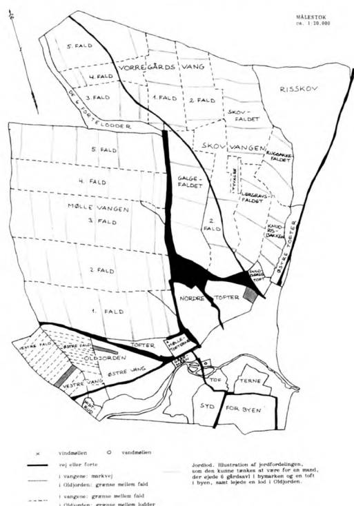
Fig. 4. Århus markjorders inddeling med henblik på dyrkingen samt illustration af jordfordelingen ca. 1800. Fremstillet af forfatteren på grundlag af udskiftnings- og matrikelkort).

var helt anderledes. Enkelte toftejorder var fra gammel tid i privat eje. Ved auktionen over ryttergodset i 1767 købte private borgere desuden en del jord bl.a. Hestehaven og Dyrehaven. Indtil 1767 havde indbyggerne jord i fæste af kongen. Ved salget af ryttergodset erhvervede købstaden 438 tdr. land, som i 1792-93 blev udskiftet til grundene i byen. 31 Det var den samme form for udskiftning, som fandt sted i Århus og Randers 200 år tidligere, men i slutningen af 1700-tallet var det en højst usædvanlig handling. Argumentet for en udskiftning til grundene var sædvanligvis, at jorderne så ville blive opdyrket til gavn for byen, men Skanderborg bymark havde været opdyrket i flere hundrede år. Desuden var man i slutningen af 1700-tallet blevet opmærksom på det uheldige i,