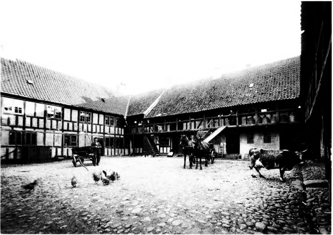
Fig. 5. J. D. Rasmussens gård fra 1700-tallet, Frederiksgade 72 i Århus. Størstedelen af gårdens etagemeter anvendes til stalde og økonomirum. Adgangen til overetagens pakhuslofter sker fra en svalegang. Gården har så sent som i slutningen af 1800-tallet husdyrhold med køreheste, fritgående høns og i hvert fald en enkelt malkeko (foto ca. 1896 i Lokalthistorisk Samling, Århus).

i betragtning, at købstæderne kun producerede til eget forbrug og ikke til eksport. Indbyggerne i Skanderborg baserede med andre ord en større del af deres økonomi på udnyttelsen af bymarken end de store købstæder. Talletne viser dog også, at avlen på markjorderne selv i de store købstæder var et ikke uvæsentligt tilskud til levnedsmiddelforsyningen, selv om man måtte købe det meste af bønderne. Købstadsmarkerne blev imidlertid udnyttet til andet end agerbrug.