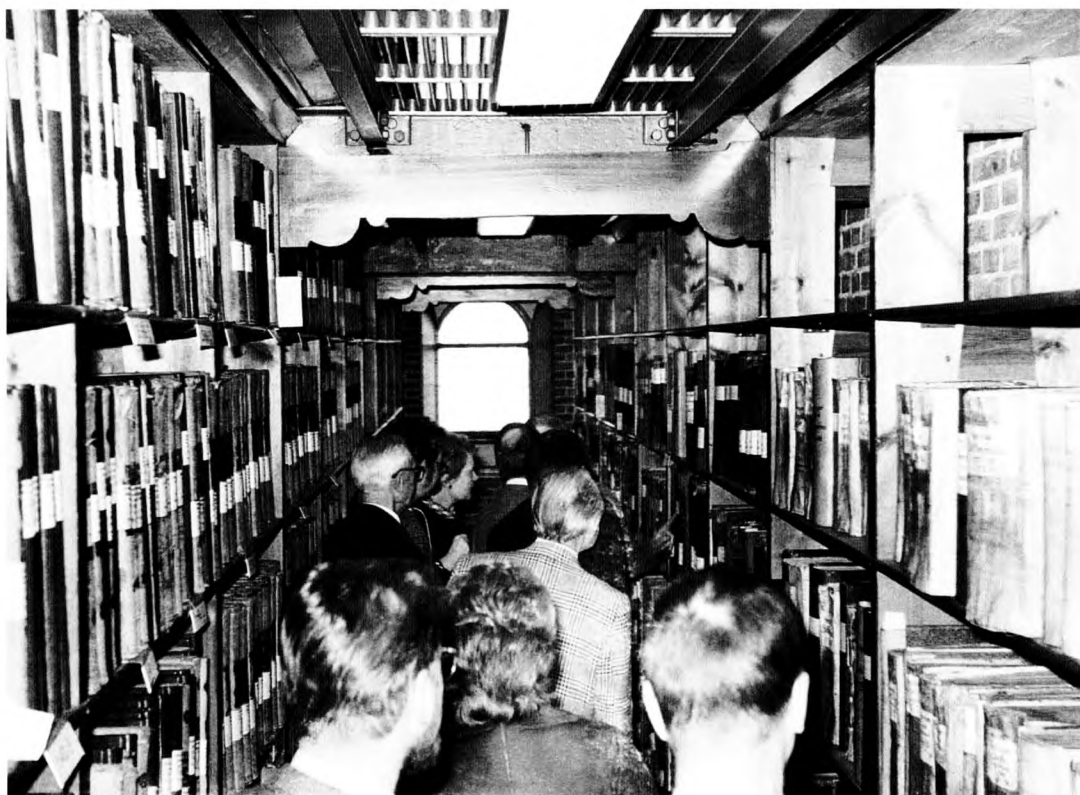
Fig. 1. Oprettelsen af landsarkiverne i Viborg, Odense og København i 1890'erne fik stor betydning for den lokalhistoriske forskning overalt i landet, idet man på de nye arkiver snart kunne finde næsten alle de vigtige kilder til lokalhistorien. Her ses en gruppe lokalhistorikere i 1970'erne på rundvisning i Landsarkivet for Sjællands gamle magasin, der er opført af Martin Nyrop.

opgave var ifølge dens formålsparagraf at koordinere samarbejdet mellem historiske foreninger, taget i bred forstand, og historiske institutioner som arkiver, museer og biblioteker. 2