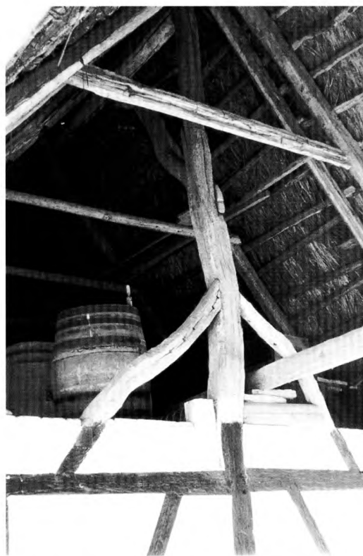
Figur 1. Sule i portfag på en gård i Haarby, Sydvestfyn. Selv om længden næppe er meget ældre end o. 1800 kan en sådan "naturgroet" sule godt datere sig tilbage fra 15-1600-årene.

Umiddelbart synes vi her at stå med et enkelt udviklingsforløb. Men billedet af byggeskikken i vikingetid-middelalder, som vi først i disse år kan begynde at tegne på baggrund af en lang række nyere udgravninger, udviser et langt mere kompliceret billede. Perioden fra omk. 900 til omk. 1200 er nemlig først og fremmest præget af en lang