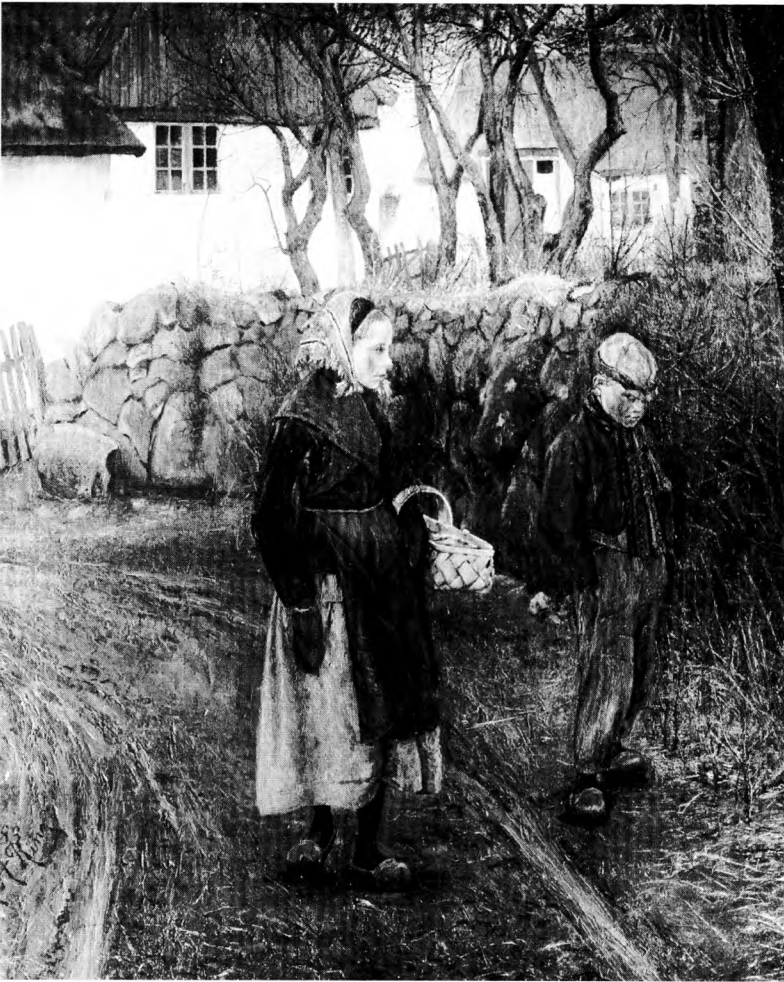
Figur 1. Maleren L.A. Ring var i begyndelsen af 1880'erne stærkt optaget af småkårsfolks livsvilkår. Her i den mest ekstreme form: det åbenlyse tiggeri. L.A. Ring: Tiggerbørn uden for en bondegård. 1883 (Privateje).

gennemføre egentlige klasseanalyser uden at gøre brug af stormaskede forklaringsformer.