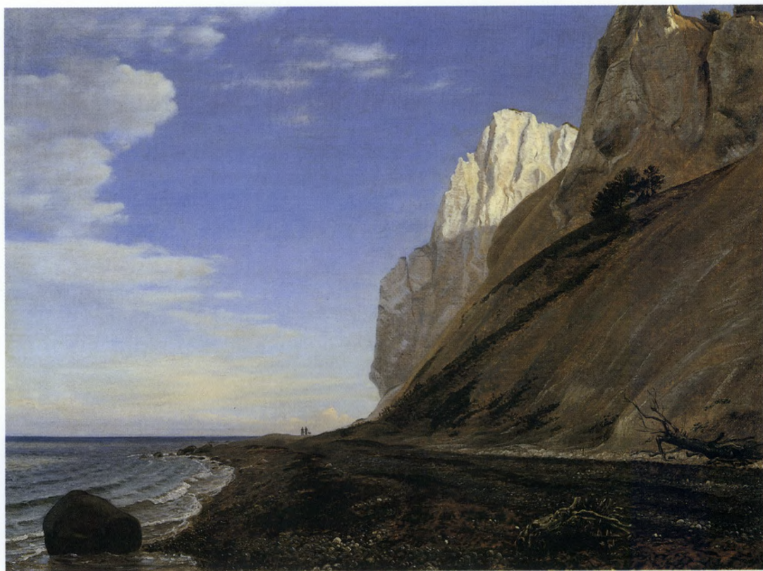
Figur 3. P.C. Skovgaards maleri »Sommerdag. Strand ved Møns Klint« fra 1843 modsvarer Molbechs opfattelse af Møns Klint som et vildt og storladent bjerglandskab. Skovgaard ville ligesom Molbech vise, at det danske landskab kunne måle sig med udlandets. Enkelte mennesker har sneget sig ind i billedet og er med til at forstærke (evt. fordreje) indtrykket af naturens overvældende dimensioner (Storstrøms Kunstmuseum, Maribo,).

melhøje Klipper og Italiens vellystige Lunde, blandt Nordens Isfælde og i Sydens evige Blomsterhave at mindes Danmarks skønne Natur, og lydt at forkynde dens Priis, uden at lade mig døve af hines skraldende Røst, som gierne vilde indbilde os, at da Naturen udgød sin Skønhed og Fylde over Europa, standsede den ved Eideren«. 31 Et ideallandskab efter international målestok var ikke motivet for Molbechs beskrivelser. 32 Molbechs motiv er, karakteristisk for den nationale turist, det særegne danske, hvilket han priser både i forhold og i modsætning til den generelle internationale målestok for skønhed. For selvom Molbechs perspektiv er nationalt, tyer han alligevel