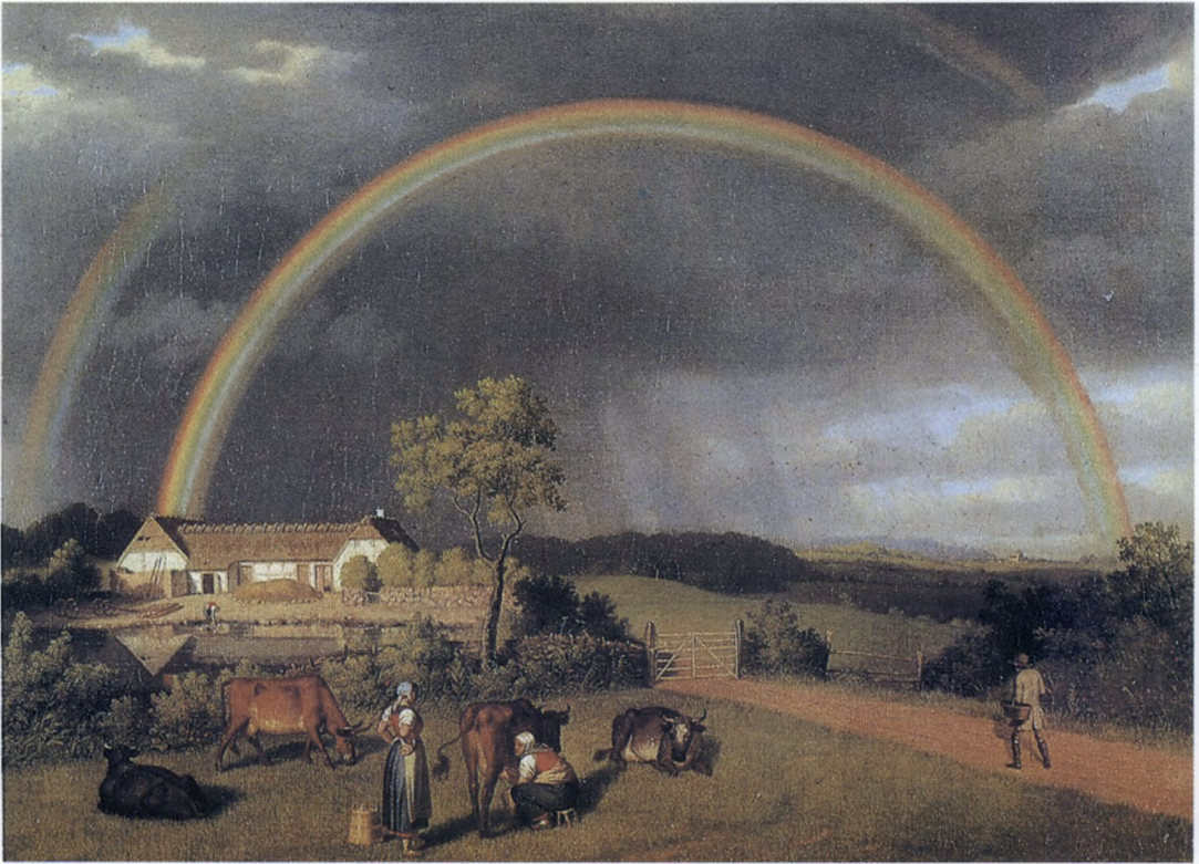
Figur 2. C.W. Eckersbergs »En udflyttergård af bondebyen Speitsby på Møen« fra 1810 viser en gård efter de patriotiske idealer: den vindskibelige bonde og hans hushold ses i målrettet aktivitet og der er orden på udnyttelsen af naturen: levende hegn om markerne, stengærde om haven og orden på mødding og redskaber. Men her er ingen national dyrkelse af folke-kultur, -dragt eller -skik, som i de senere generationaler (Kunsthalle, Kiel).

den proces, hvor historien omskrives til en national fortælling, med den dertil knyttede udpegning af særlige erindringssteder og fravalg af andre steder i historien. Hans historie er knyttet til landskabet via fortidslevnene, der har oplevelsespotentialer, fordi de ses som forstenet historie og som relikvier, der rummer fortidens kraft i sig. I forhold til relationen mellem historie og landskab er Molbechs historieopfattelse organisk, men i forhold til folket er den ikke. Hans historiesyn er snarere udtryk for et brud mellem to diskurser. Et udtryk for overgangen mellem de fædrelandskærlige enkeltpersoner, der er det historiske subjekt i den patriotiske diskurs og folket og folkeånden, der er subjekt i den national-romantiske diskurs.