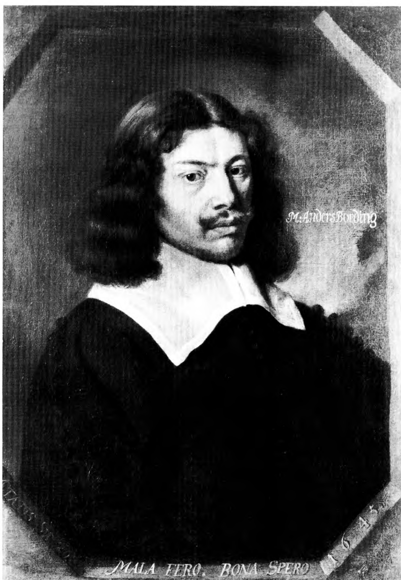
Anders Bording (1619-1677) var en politisk fintfølede digter, hvis politiske lejlighedsdigte formfuldendt og præcist afspejler samspillet mellem folkestemning og politisk propaganda inden for rammerne af den til enhver tid gældende politiske korrekthed. Maleriet er med urette blevet tilskrevet Karel v. Mander, og det viser Bording som ung mand på et tidspunkt, hvor han allerede havde skabt sig et navn som hyrdedigter.

I de næste to linjer (65-66) spindes videre på kongens fremragende egenskaber, samtidig med at der indirekte hentydes til den kongelige arverettig-