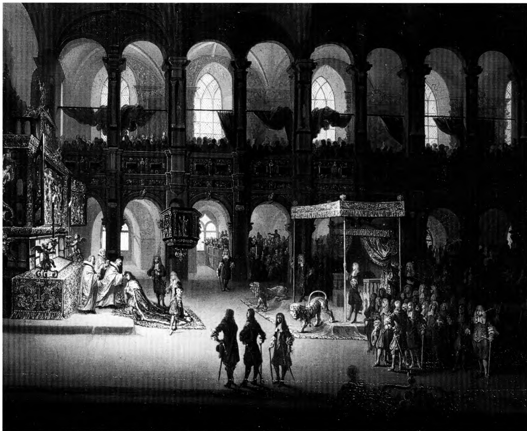
Dette maleri af Christian V's salving 1671 rummer en række uoverensstemmelser med virkeligheden: Tronen er for bred, slotskirken virker langt større end i virkeligheden, og der ses intet spor af den tribune, der ifølge salvingsbeskrivelsen strakte sig fra alteret hen til tronen. Til gengæld giver billedet af salvingsøjeblikket gennem sin manipulation med lys og skygge et stærkt indtryk af en fortættet religiøs atmosfære. Maleriet er tilskrevet Peder Andersen eller Anton van Steenwinckel.

man at ombygge kroningsceremonien i enevældens billede og gøre den til kulminationen på den ovenfor anførte række af ceremonielle initiativer. Det, man gjorde, var at fjerne eller erstatte alle elementer af kontraktlære i det gamle ceremoniel. Det sakramentale, salvingens guddommelige sanktion af kongemagten, bibeholdtes derimod, selv om der officielt ikke længere var tale om en retsstiftende handling, men blot om en kongelig »devotionsakt«, dvs. et udtryk for kongelig fromhed og ydmyghed over for Gud. Edsaflæggelsen blev derfor selvfølgelig strøget,