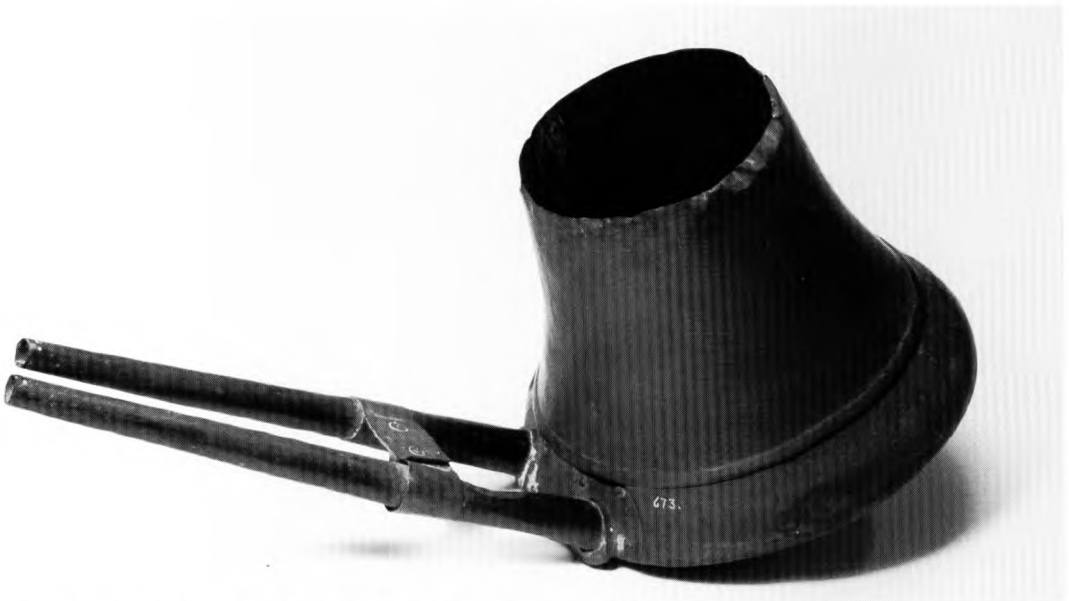
Figur 2. Et af de redskaber til fremstilling af brændevin, som blev beslaglagt i Salling omkring 1690 kunne have været denne sprithat, der i dag befinder sig på Skive Museum.