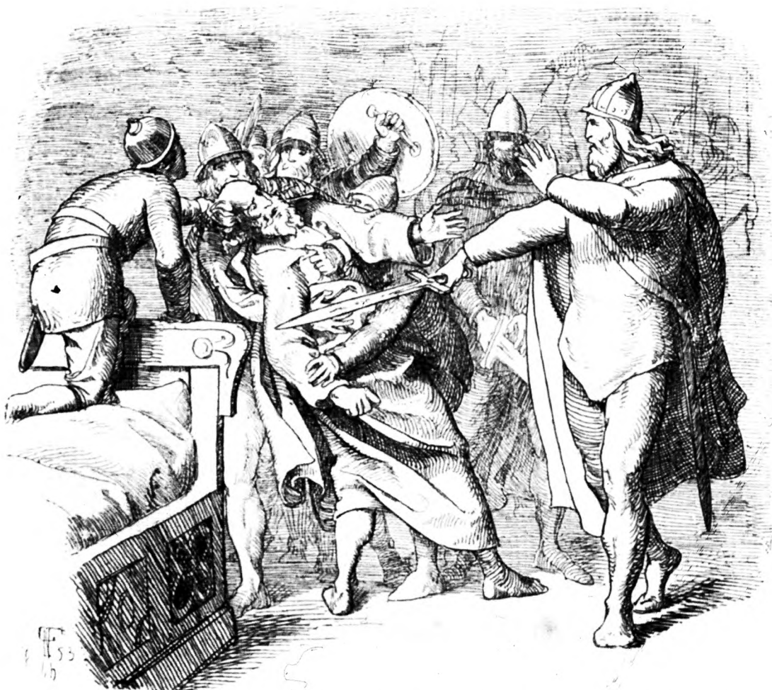
Fig. 9. Lorenz Frølich (1820-1908): Niels Ebbesen fælder Grev Gert. Radering 1853. 100 x 115 mm. Illustration til Fabricius: Illustreret Danmarkshistorie for Folket, 1854. Kobberstiksamlingen, Statens Museum for Kunst. Niels Ebbesen er nok den dansk-nationale helt, der har appelleret mest til kunstnere gennem tiden. De gode står sammen og vinder derved over de onde – ligesom i et rigtigt eventyr. Lorenz Frølich formåede med enkle streger i sine små illustrationer at ramme stemninger, som beskueren selv kan digte videre på.

blev opkrævet af de holstenske grever. Men krigen fortsatte, og kongen blev mere og mere forgældet. Ved sin død i 1333 havde Christoffer 2. stort set mistet alt – undtagen kongetitlen. Johan af Plön havde Sjælland og Skåne i pant, og Gerhard af Rendsborg havde Jylland og Fyn. Danmarks riges skæbne blev dog ikke kun afgjort af kongelige gældsbeviser. Der rejstes et oprør mod holstenervældet, i første omgang