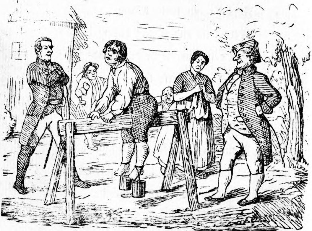
Fig. 14. Anonym: Bonde på træhest. Xylografi 1842. 80 x 116 mm. Illustration til Frolund & Flinchs Almanak 1842, også gengivet i Billedbog for Børn 1843. Bøndernes forhold før landboreformerne blev i 1800-tallet ofte skildret som nærmest umenneskelige: Bonden plages på træhesten. Hans kone vrider hænder i fortvivelse, barnet græder, og de onde ler overmodigt. Oplysningstidens frihedsidealer og demokratiske tendenser kunne styrkes af sådanne skræmmebilleder, og bønderne blev mindet om, at de skulle være taknemmelige for de nye tider.

Reformerne, som Frihedsstøtten og Eckersbergs malerier forherliger, er i tidens løb sat i skarpt relief af illustrationer, der viser elendigheden i tiden før landboreformerne. Især i 1800-tal-