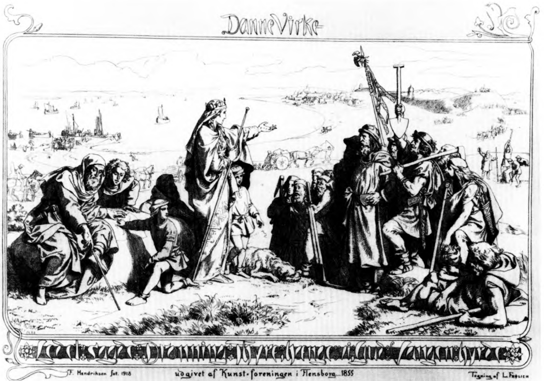
Fig. 3. Lorenz Frølich (1820-1908): Thyre Danebod anlægger Danevirke. Radering 1855. 315 x 460 mm. Museet på Sønderborg Slot. Kunstforeningen i Flensborg udsendte i tiden mellem de to slesvigske krige det lille grafiske tryk Dannevirkebladet. Det fik en stor gennemslagskraft, og blev trykt flere gange og ofte anvendt som bogillustration. Thyre er den store danske heltinde, der trådte frem fra sin husbond, kong Gorms skygge, da det var nødvendigt. Frølichs fortolkning af dronningen som nationens redningsmand og kærlige moder er trods sin lidenhed et af de mest elskede billeder i dansk historiemaleri.

krigssang blev den udsendt som skillingstryk til soldaterne i april 1848 ved udbruddet af Treårskrigen. Thyre Danebod-visen har haft en stærk opildnende effekt, både i kraft af smukke, forførende fjendebilleder og en velklingende, sangbar melodi.