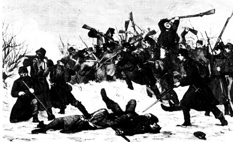
Fig 16. Anonym: Første Infanteriregiment i Haandgemæng med Regiment Martini den 6. Februar 1864. Xylografi 1864. 165 x 240 mm. Illustration fra Illustreret Tidende 1864. Museet på Sønderborg Slot. Under tilbagetrækningen fra Danevirke kom de danske tropper i fægtning med forfølgerne. Mellem Oversø og Sankelmark syd for Flensborg var der en kamp med betydeligt tab både af danske og østrigske soldater. Billeder som dette styrkede befolkningens medleven i krigen og blev hurtigt udbredt gennem Illustreret Tidende og Illustrirte Zeitung. Begge tidsskrifter havde egne tegnere med ved fronten. Herfra sendte de skitser til København og Berlin, hvor de blev omsatte i xylografer, datidens massemedium.