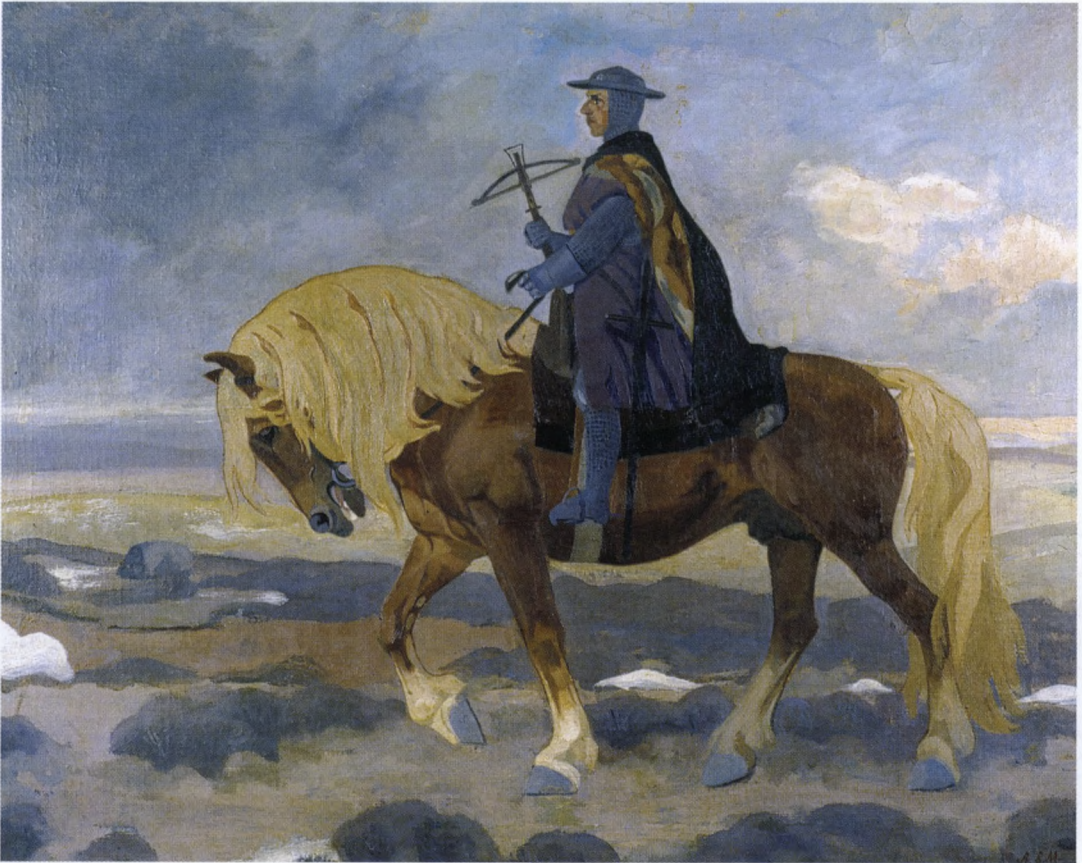
Fig. 10. Agnes Slott-Møller (1862-1937): Niels Ebbesen. Maleri, olie på lærred, 1893. 78 x 93,5 cm. Privateje. Maleriet er forarbejde til et ikke-flytbart monumentalmaleri, som en komité af damer samlede ind til og skænkede til Randers Kunstmuseum i 1907. Niels Ebbesen rider bort efter heltedåden. Han har tydeligvis gjort sin pligt for fædrelandet og virker næsten utilnærmelig i sin målbevidsthed. Slott-Møller har stræbt efter at beskrive prototypen på en rigtig dansk helt, der uden tanke for sig selv udfører det nødvendige.

» Om Danmarks kvide der lød en sang så sørgelig: der var ingen konning i Danevang men borgerkrig; dansen var fredløs i skov og på hede, herrer vi havde af himmelens vrede,