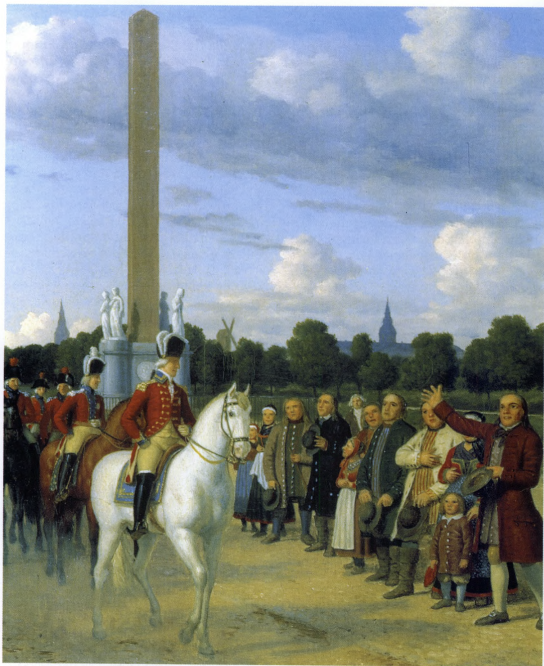
Fig. 13. C.W. Eckersberg (1783-1853): Danske bønder takker ved Frihedsstøtten Frederik 6. for stavnsbåndets løsning. Maleri 1844. 38,5 x 28,5 cm. Det Nationalhistoriske Museum på Frederiksborg Slot. Billedet er en gentagelse af det ikke-flytbare monumental-maleri, som Eckersberg i 1839 havde færdigt til udsmykning af trongemakket på Christiansborg Slot. Med Frihedsstøtten som markant og betydningsladet staffage mødes kongemagten og folket i en situation, hvor afstanden mellem dem er tydelig. Det offentlige i scenen forstærkes i denne version af motivet af, at borgere i baggrunden observerer optøret. Eckersberg markerede med den oprindelige titel: En hentydning til Stavnsbaandets løsning under Christian den 7., at hændelsen var konstrueret. Også tårnet af det første Christiansborg, der brændte i 1794, ses i baggrunden, på trods af at Frihedsstøtten først stod færdig i 1797.