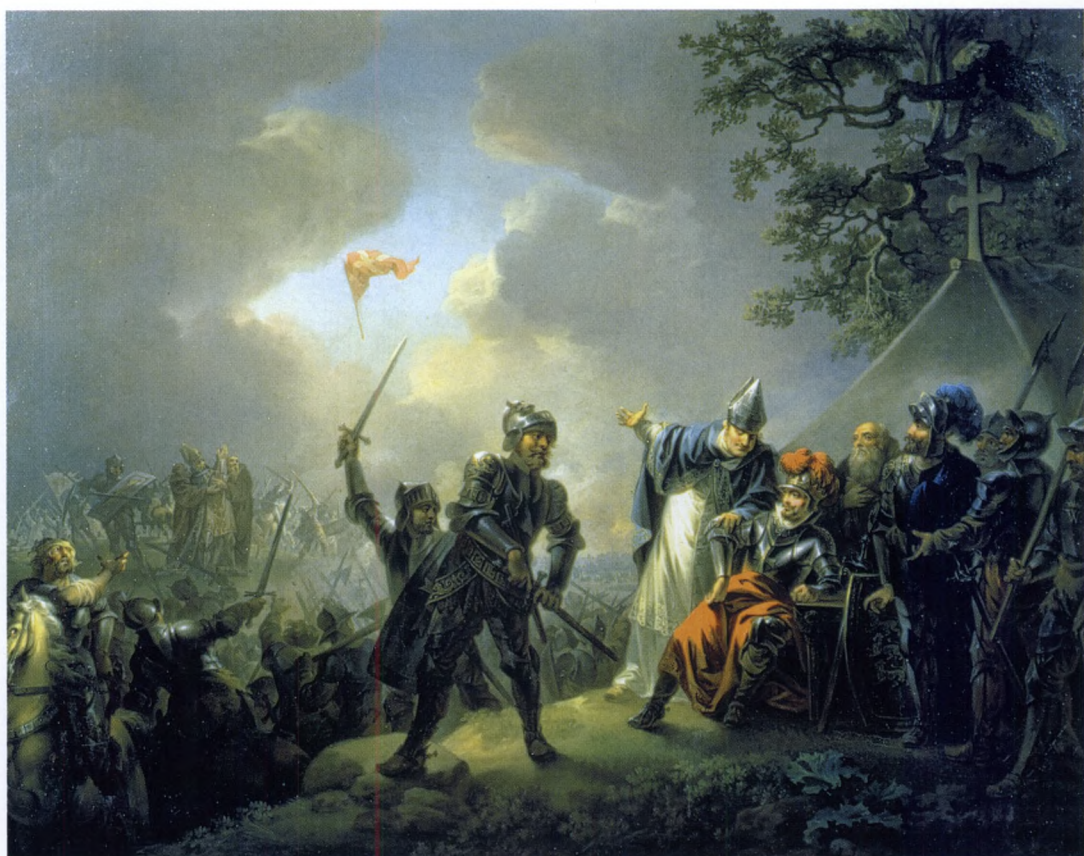
Fig. 7. C.A. Lorentzen (1749-1828): Dannebrog falder ned fra himlen under Volmerslaget ved Lyndanis 15. juni 1219. Maleri, olie på lærred 1809. 102 x 128,5 cm. Købt 1815 til Den kongelige Malerisamling. I dag på Statens Museum for Kunst. Maleren var sønderjyde og født i Sønderborg i 1746. Han udførte dette maleri som trøst for sine landsmænd under Napoleonskrigene, hvor det så sort ud for Danmark. Billedet kan opfattes som en illustration til Ingemanns sang om Dannebrog med linjerne "Fra himlen er du faldet, du Danmarks helligdom". Den tilbagelænedede konge, Valdemar Sejf, synes næsten at have forventet vendepunktet i slaget. I Lorentzens fortolkning af den klassiske myte fremhæves kongen på bekostning af den egentlige helt, biskoppen, der henlede Guds opmærksomhed på, at den danske hær havde indtrængende brug for hans hjælp.

bevidstheden hos de fleste danskere. Ingemann skrev sangen under Napoleonskrigene, efter at englænderne havde bombarderet København og erobret den danske flåde. Denne ulykke bevirkede, at der opstod interesse for nationale symboler som Dannebrog. Året efter, i 1808, blev den danske ridderorden Dannebrogordenen ændret, så langt flere danskere kunne modtage denne hædersbevisning. Ordenstegnet er et hvidt kors med røde kanter, og på bagsiden er anført årstallet 1219