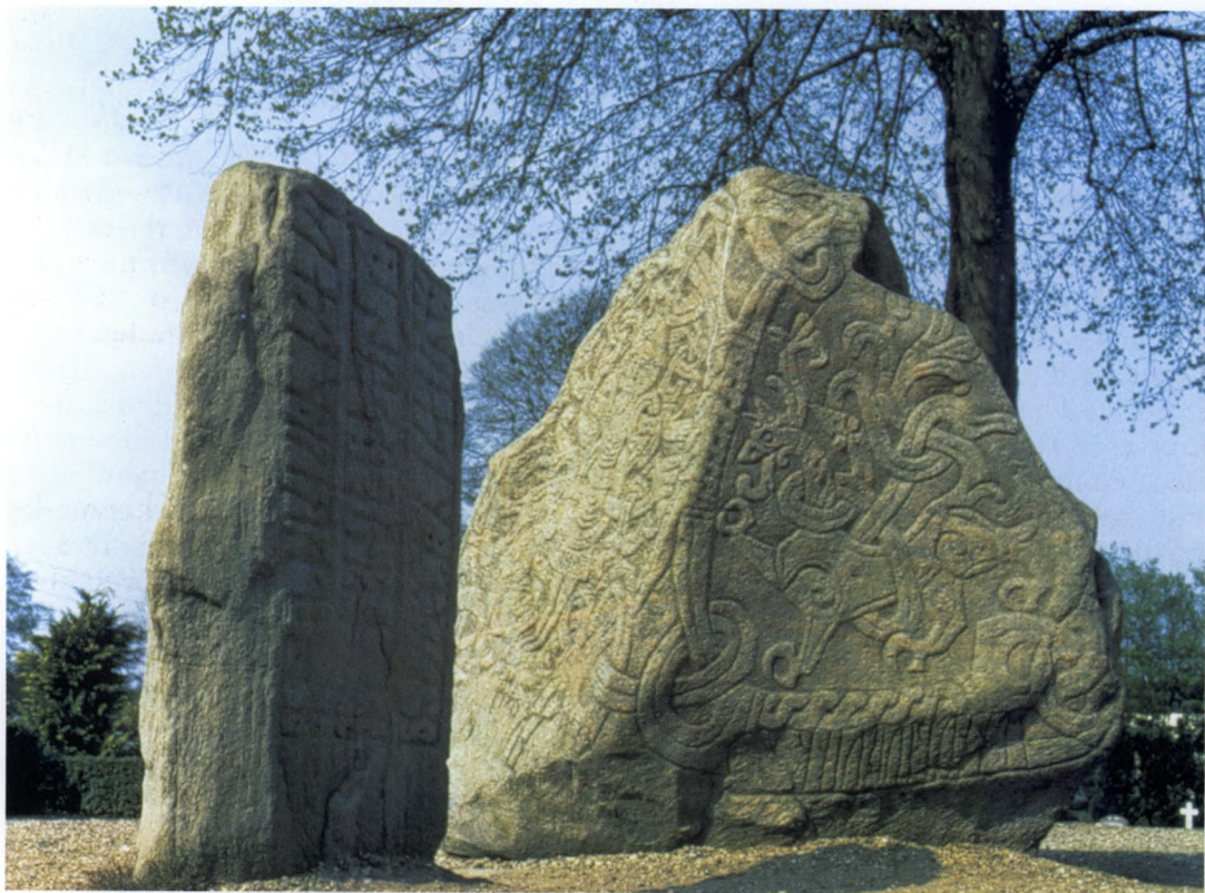
Fig. 1. Runestenene i Jelling, ca. 950-80. Ved Jelling Kirke i Midtjylland. Danmarks dåbsattest er de to store runesten blevet kaldt. De betragtes som helt centrale dele af den danske kulturarv og er optaget på UNESCO's liste World Heritage Monument. Runestenene er rejst mellem to kæmpehøje, hvor det først kendte danske kongepar Gorm og Thyre efter overleveringen skulle være begravet. På den mindre sten t.h. fortæller en indskrift, at Gorm rejste stenen efter sin hustru Thyre, Danmarks pryd (=Danebod). På den største runesten er der tre flader; den ene viser et stort dyr i kamp med en slange, på den anden ses Kristus med korsglorie og båndslang, mens den tredje side rummer en indskrift af Thyres og Gorms søn Harald. Han fortæller, at han vandt sig al Danmark og Norge og gjorde danerne kristne. Thyre er således nævnt på begge runesten, og dette har været med til at udbygge og fastholde myten om hendes betydning for det danske rige.

museer og andre offentlige kunstsamlinger. Kunstforeninger udsendte grafiske tryk af disse billeder og gjorde dem kendte i en bredere del af befolkningen. Reproduktioner af varierende kvalitet blev folkeligt eje og prydede væggene i utallige private hjem og offentlige bygninger, ikke mindst skoler. Skolebøger, historisk faglitteratur og forskellige fædrelandshistoriske bøger blev også illustreret med tryk af denne type. Selvom flere af de centrale myter kun findes i få kunstneriske fortolkninger, kunne dette undertiden styrke