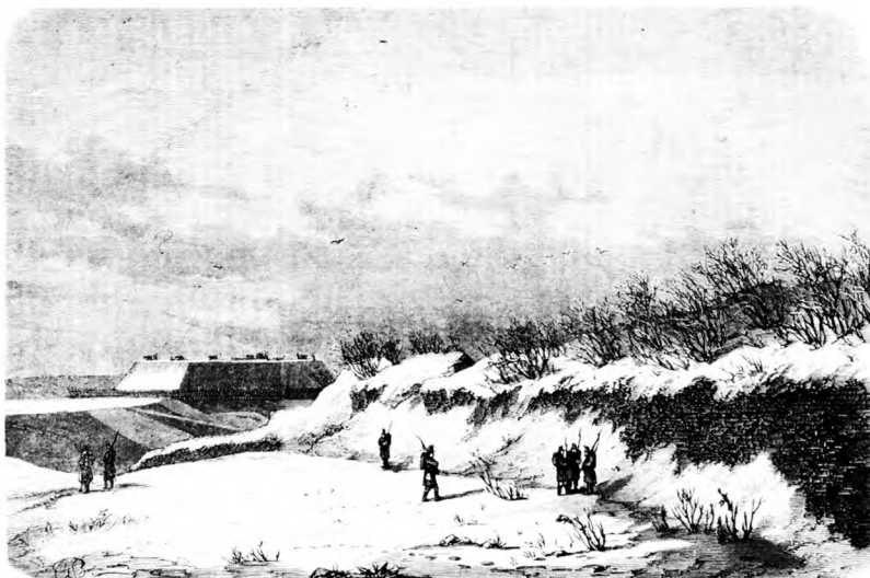
Fig. 15. Anonym: Parti af Danevirke med en af de nye Skanser, Thyras Vold og Valdemarsmuren. Xylografi 1863-64. 17 x 24 mm. Illustration fra Illustreret Tidende 10. januar 1864. Museet på Sønderborg Slot. Illustrationer som denne var sammen med skrevne reportager medvirkende til at give befolkningen indblik i de vilkår, soldaterne kæmpede under. Den sagnomspundne oldtidsvold, Danevirke, havde alle danskere hørt om, og troen på dens uovervindelighed var udbredt i alle befolkningslag. Så meget desto større var fortvivlelsen og vantroen, da Danevirke blev rømmet uden kamp og den danske hær trak sig tilbage til Dybbøl. Det hæderfulde nederlag manglede, og helt grundløse beskyldninger om forræderi svirrede!