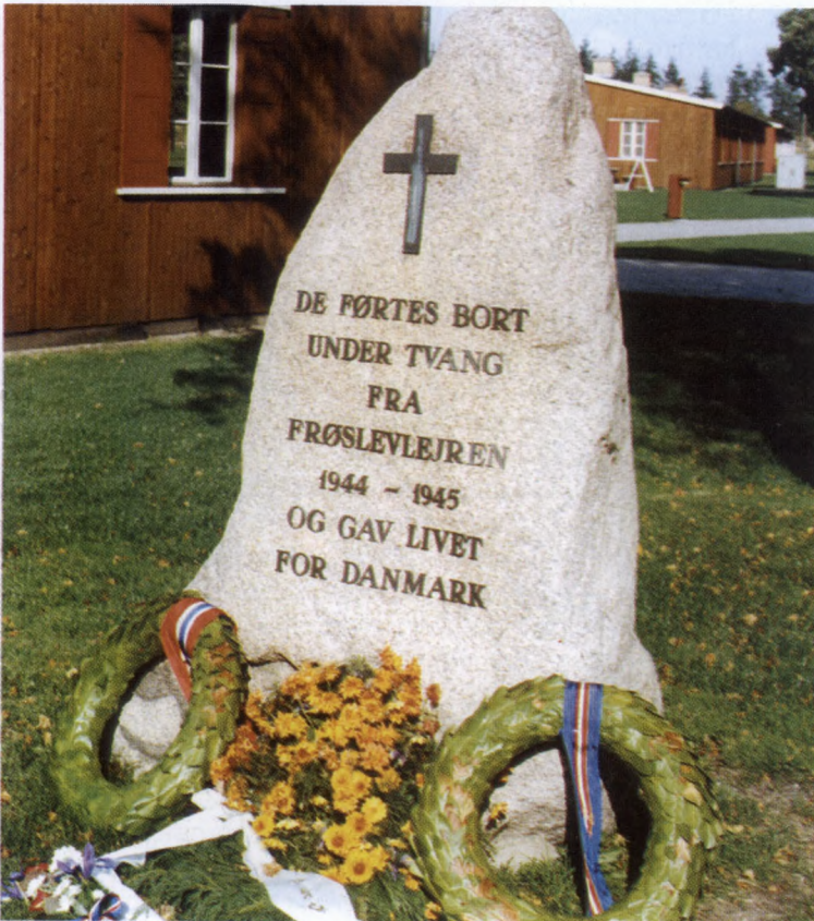
Mindesten over de Frøslevfanger, som blev deporteret til KZ-lejr og mistede livet dér. Stenen blev rejst ved lejrens hovedvagtårn i 1968. Fangebarakken i baggrunden danner sammen med hovedvagtårnet rammen om Museet for Frøslevlejren, hvis udstilling bl.a. beretter om de forhold, der mødte Frøslevfangerne i tysk KZ-lejr.

Fælles for disse museums- eller museumslignende aktiviteter er, at de i større eller mindre udstrækning finansieres af deres organisatoriske bagland og i øvrigt i udstrakt grad drives af frivillige fra de respektive organisationer. Det høje besøgstal i Frøslevlejrens Museum gjorde det attraktivt for disse organisationer at etablere sig i Frøslevlejren. I 1991 opsigde Dansk Røde Kors