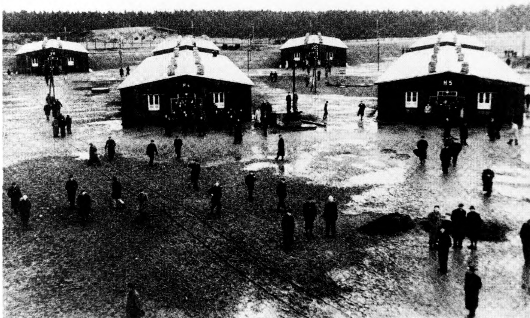
Udsnit af Frøslevlejren den 5. maj 1945. Billedet, som er taget fra lejrens hovedvagtårn, viser et trøstesløst, pløret område. I dag fremstår lejren indbydende med beplantning, flisebelagte veje og store græsarealer. Forskønnelsen, som er sket gradvis siden 1950'erne, er blevet foretaget af hensyn til lejrens brugere og mange gæster.

teret til KZ-lejr i Tyskland, hvor de blev konfronteret med ganske andre forhold end i Frøslevlejren. Den evige trussel om deportation kom til at hvile som en tung skygge over Frøslevlejren. Ingen kunne vide sig sikker!