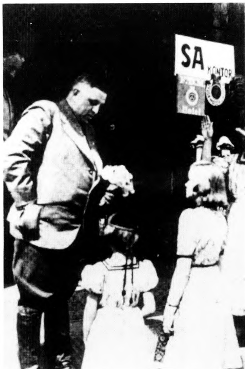
Føreren modtager blomster af småpiger ved sin ankomst til Kolding. Over for omgivelserne skal denne kliché på en statsmandsoptræden give associationer til personens betydningsfuldhed.

kationer, men havde sagt nej. En anstødssted i det dansk-norske samarbejde havde været Grønlandssagen, hvor begge de stærkt nationale partier stod på deres ret. Det havde krævet tid for det norske broderparti at komme sig over nederlaget i den sag. 25 Nu så der ud til at åbne sig nordiske muligheder for et nazisamarbejde.