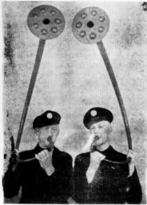
De fleste kender de danske de Vindinstrumenter, Navnetet af denne danske Dannefødsel og af den danske af den nordiske »De danske Lurer«. DNSAP's første offentlige præsentation af de danske lurer og to af partiets lurblæsere. Fædrelandet den 24. maj 1939.

Som omtalt vil der ved D. N. S. A. P.'s Landsstævne i »Koldinghus« Slotsgaard, Søndag den 18. Juni finde en De- monstration Sted af de gamle danske Lurer, en Demonstra- tion af stor videnskabelig og historisk Betydning. Den er fatsat til Kl. 17.