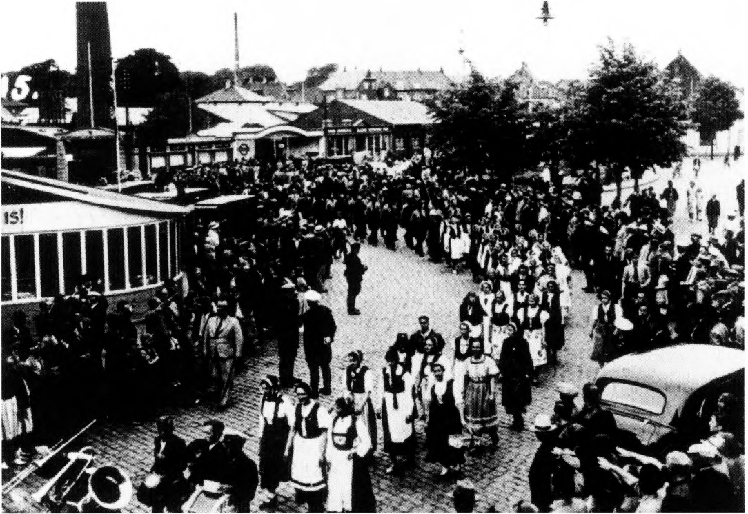
Nationalsocialistiske kvinder i »nationaldragter«. Fotografi fra den første dag af landsstævnet i Kolding. Optøget er på vej fra banegården til Alhambra med NSU's orkester i spidsen.