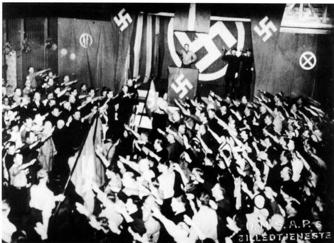
Landsstævnet åbnes med »nordisk hilsen« i Alhambras store sal lørdag eftermiddag.