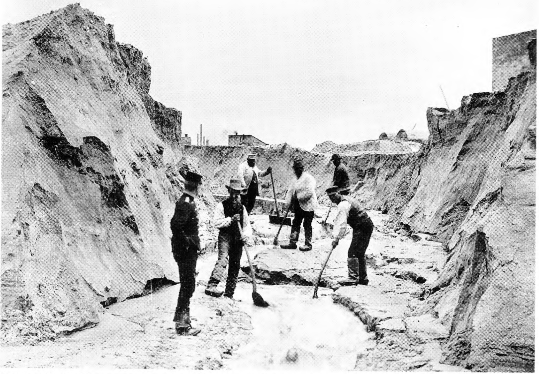
Før provisorietiden var store dele af Venstre positive over for en befæstning fra søsiden. Men i 1889, da regeringen forelagde et lovforslag om en styrkelse af søbefæstningen, havde byggeriet af landbefæstningen allerede lagt beslag på store dele af det finansielle overskud. Ydermere blev Middelgrundsfortet betragtet som en del af den nu mere eller mindre virkeliggjorte landbefæstning. Efter lovforslagets fremlæggelse i Folketinget blev det sendt i udvalg. En udvalgsbetænkning med kras kritik af forslaget var på trapperne, da regeringen i januar 1890 udskrev folketingsvalg. I samlingens anden afdeling blev forslaget taget op på ny, nu med en reduktion af budgettet på 25%. Forslaget blev forkastet. På billedet, som er fra juni 1893, udskyller arbejdere sandfyld i forbindelse med byggeriet af Middelgrundsfortet.

nen på Sorgenfri. Der var stadig brug for gendarmerne, for fæstningsarbejderne blev nemlig i området og tog høstarbejde på de omkringliggende gårde. 95 Gendarmstationens nedlæggelse har formentlig været et løst rygte, gendarmerne blev i Lyngby provisorietiden ud.