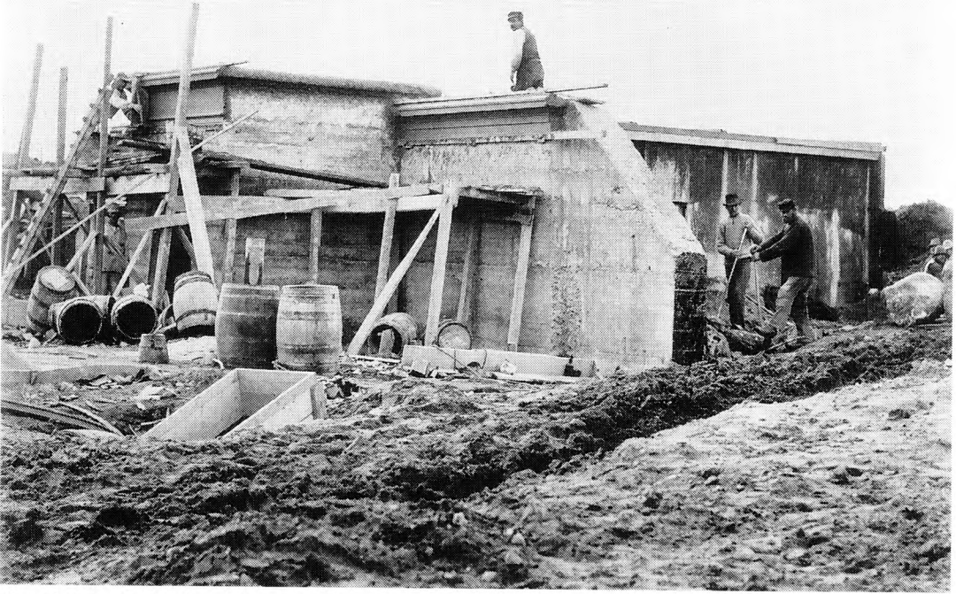
Foruden jordarbejderne byggedes der ved Husumenceinten i oktober 1889 et krudtmagasin, batar-duer, kaponierer og boliger til opsynspersonalet. Endvidere blev der gravet et underløb under Harestrup å, og de dele af Husumenceinten, som stod færdige, blev heget og beplantet. Samtidig arbejdedes der på alle fire afsnit af Vestenceinten, på Gammelmossegårdsfortet, Christiansholmsbatteriet og på Stenmarken ved Aunsøgaard (grusgrav og skærvefabrik i Nordvestsjælland). I oktober 1889 arbejdede godt og vel 1.600 arbejdere på den del af befæstningen, som hørte under Krigsbestyrelsen, heraf var ca. 1.280 arbejdsmænd.

kræftede Matzens meget generelle og mørke fremstilling, og selv om Bahnson langt fra lovede at gøre mindre brug af private entreprenører i fremtiden, så erklærede Matzen sig dog tilfreds med krigsministerens svar. 64 Alligevel kan forespørgslen godt have tjent bredere formål end blot at lade krigsministeren udtale sig. Henning Matzen havde nære forbindelser til en samtidig spirende antisocialistisk arbejderbevægelse. Og bevægelsen kunne naturligvis ikke i længden leve med, at dens loyale støtte til regeringen blev modsvaret af arbejdsforhold som dem ved kanalen.