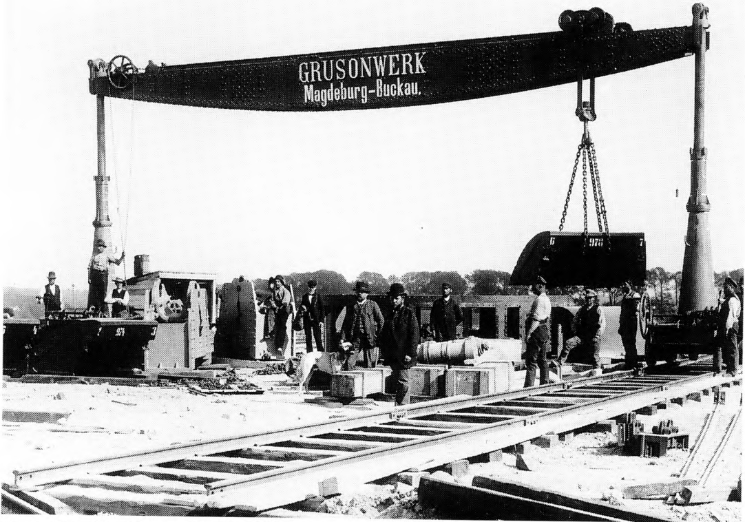
Pansertårnet fra Grusonwerk – «Folkets Taarn», som den lokale højre-avis kaldte det – blev opstillet på Garderhøjen i løbet af maj 1889. Det blev bestykket med to store kruppske kanoner. I slutningen af juli skulle militæret holde øvelse med henblik på tårnets og kanonerens betjening. I slutningen af juli skulle militæret holde øvelse med henblik på tårnets og kanonerens betjening. Hvis Københavns Amts-Avis' ord står til troende, havde hærens ledelse først måttet indhente Selvbeskatningens tilsagn, før øvelserne kunne finde sted.

for den enkelte og en positiv økonomisk udvikling for samfundet. 56