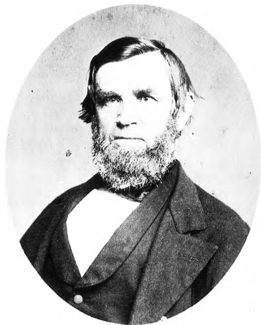
Søren Jaabæk (1814–1894). Jaabæk var lærer og gårdbruger og baserede sin landspolitiske karriere som bondepolitiker på et solidt fodfæste i lokalpolitikken i Lister og Mandals amt. Selv om hans bondevenneforeninger udviklede sig til den første egentlige partiorganisation i Norge, gik Jaabæk ikke gerne på kompromis med andres synspunkter og holdninger, heller ikke blandt sine egne. Takket være sin konsekvente sparepolitik og rationalistiske indstilling blev han af sine modstandere betragtet som indbegrebet af åndløs materialisme og småtskårethed. Han kom her til at dele vilkår med sin meningsfælle i Danmark, Lars Bjørnbak.

Mandalforeningens program blev taget op i næsten identiske formuleringer