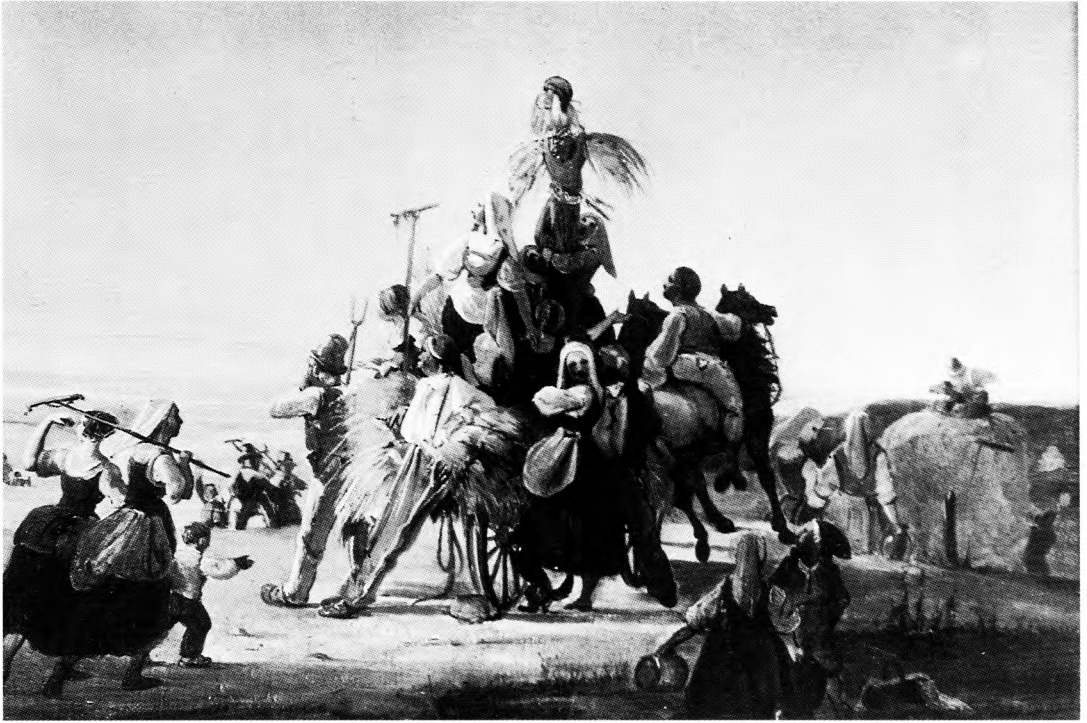
H.I. Hammerich: Det sidste læs køres ind, 1844. Pittoresk folkeliv eller idyllisk genrebillede – sådan ville borgerskabet gerne se bonden. Der var straks flere betænkeligheder, når det gjaldt om at give bonden politiske rettigheder og social ligestilling, og det gjaldt langt ind i Bondevennernes Selskab. Det måtte i al fald være den selvfølgelige forudsætning, at bønderne underordnede sig de mere dannedes førerskab.

fra bondevenner ude i landet, men det er også muligt at udnytte et stort antal forhandlingsprotokoller fra lokalforeninger. Lokalforeningerne lagde stor vægt på at konstituere sig som foreninger med hele det tilhørende formelle apparat.