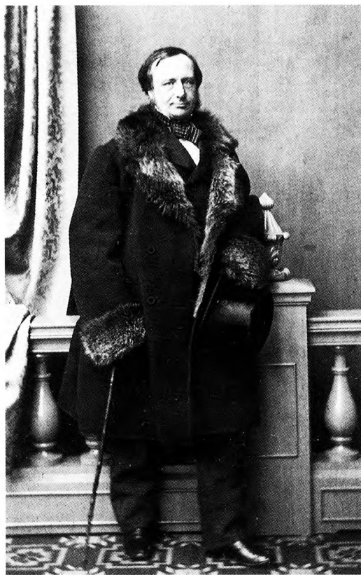
P. A. Munch (1810–1863) havde varig betydning for norsk historieforskning og for udviklingen af en norsk nationalfølelse. Hans hovedværk, Det norske Folks Historie, forblev uafsluttet. Han var ved sin død nået frem til 1397, men allerede skildringen af denne periode fylder 8 bind.

Munchs bredside mod skandinavismen blev mødt med kritik både i norske aviser og i det danske Fædrelandet, og navnlig blev hans indvandringsteori an-