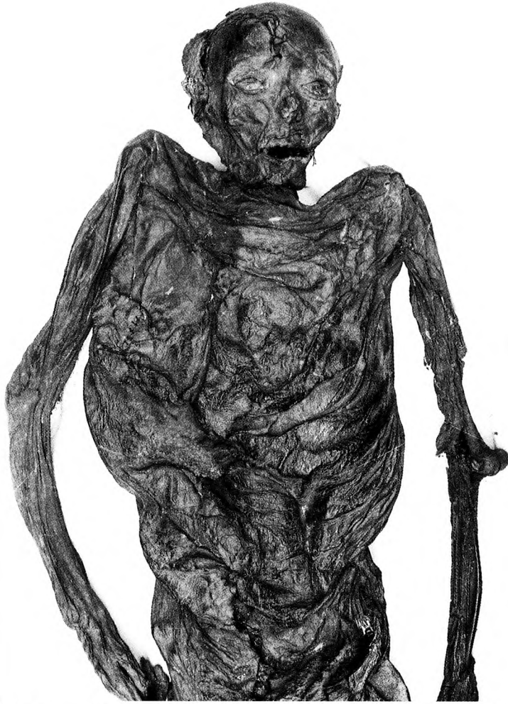
»Dronning Gunhild« fotograferet i Vejle Skt. Nikolaj kirke, hvor hun endnu ligger i den kiste, som Frederik 6. skænkede til formålet. Liget er senere blevet kulstof-14-dateret til ca. 450 f.Kr.

tæller de to berømte herrer, Grauballemanden og Tollundmanden. Ved Haraldskær-kvindens fremkomst var der imidlertid stor mystik omkring tolkningen af fundet, selv om man nok var klar over, at det var af ældre dato. Da liget samt de tilhørende tekstil- og skindfragmenter, der var rester af kvindens klædedragt, blev beskrevet i Annaler 1836–37, 4 var det da også uden nogen form for konklusion.