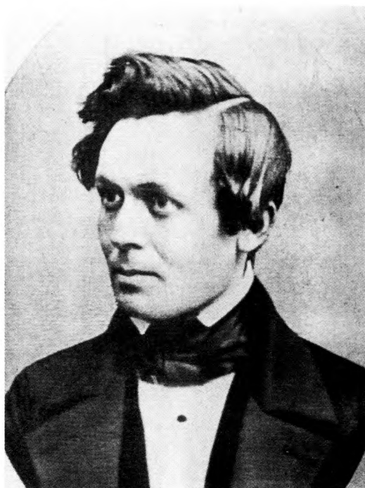
Jens Jacob Asmussen Worsaae (1821–1885) som ung mand.

alene tilskrives hans enorme indsats, at oldsagssamlingen i 1819 kunne åbnes for publikum. Under det oprydnings- og systematiseringsarbejde, der langtfra var afsluttet ved samlingens åbning, blev det efterhånden klart for Thomsen, at oldsagsmaterialet kunne inddeles i tre kronologisk bestemte kategorier: en sten-, en bronze- og en jernalder. Treperiodesystemet, som inddelingen kaldes, havde ganske vist været kendt længe før Thomsens tid, men kun som hypotese fremført af bl.a. græske forfattere. Thomsen var derimod den første i verden, der beviste systemets gyldighed ved direkte iagttagelse af fund og fundkombinationer. Med denne pionerindsats føjede Thomsen sit navn til rækken af forskere, der i disse år inden for såvel natur- som humanvidenskaberne arbejdede på at erstatte spekulation og litterær tilbageslutning med moderne empiriske metoder. Observation og eksperiment var nøgleordene, og en