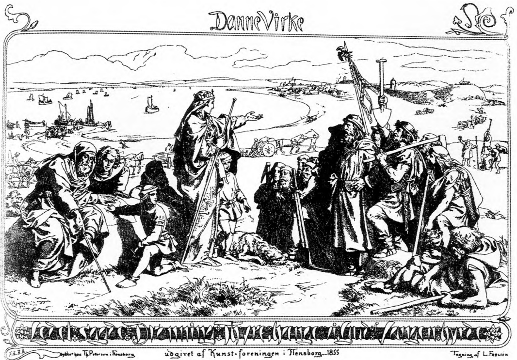
Tegneren Lorenz Frølichs romantiske opfattelse af, hvordan dronning Thyras »nationale grænseværn«, Dannevirke, var blevet til. Tegningen blev udgivet af Kunstforeningen i Flensborg i 1855.

Efter vikingetiden med dens sammenhold og forsvarsvilje fulgte middelalderen som en periode præget af splittelse og nationalt forræderi. Det var i dette tidsrum, den skæbnesvangre udskillelse af Slesvig som hertugdømme fandt sted, og kulminationen på den ulykkelige udvikling kom i 1460 med Christian 1.'s forpligtelse til at lade Slesvig og Holsten forblive »evig tilsammen udelte«. Det var primært denne formulering, de slesvig-holstenske oprørere nu påberåbte sig, og som man fra dansk side gjorde alt for at undsige. I den nationalliberale forståelse havde Danmark nemlig en historisk ret til