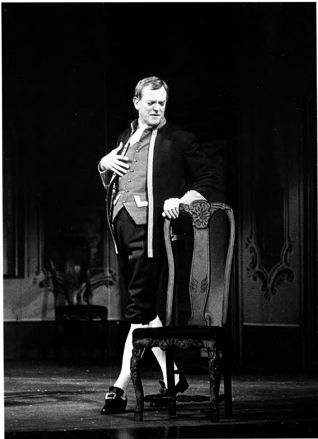
Henrik forsvarer Leander for tamperretten – stolen! – i Holbergs komedie Mascarade. Her fra en forestilling på Det Kongelige Teater med Jesper Langberg i rollen som Henrik.