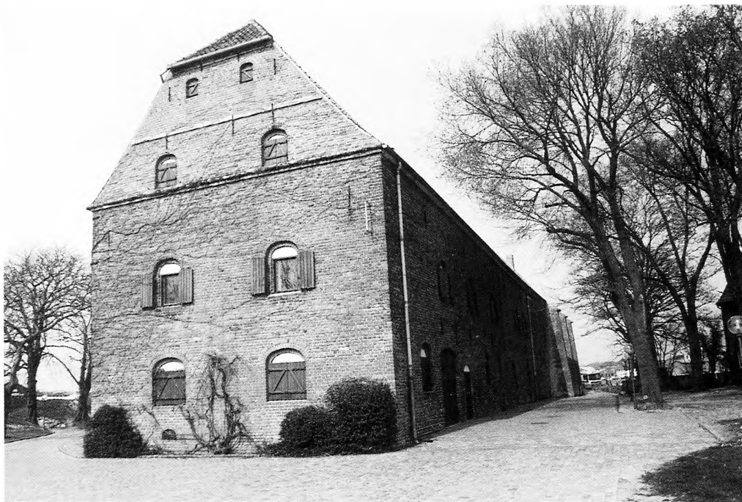
Den 56 m lange og 11 m brede magasinbygning på Korsør fæstning - opført i begyndelsen af 1600-tallet - blev i 1700-tallet brugt til opmagasinerung af korn til offentligt forbrug. En indberetning fra 1743 oplyser, at huset kunne rumme 600-700 tdr. korn og "Krudt og Kugler neden under" (Danske kancelli. D 102a). Der lå magasinbygninger i mange danske købstæder - dog fortrinsvis i byer med amtstuer. Kornet kom fortrinsvis ind gennem kornskatter fra bønderne i amtet, og det meste af kornet blev anvendt af militæret. Ved akut kornmangel i den pågældende landsdel kunne der dog åbnes for et magasin, således at den lokale befolkning for et beskedent beløb kunne modtage en afmålt ration.