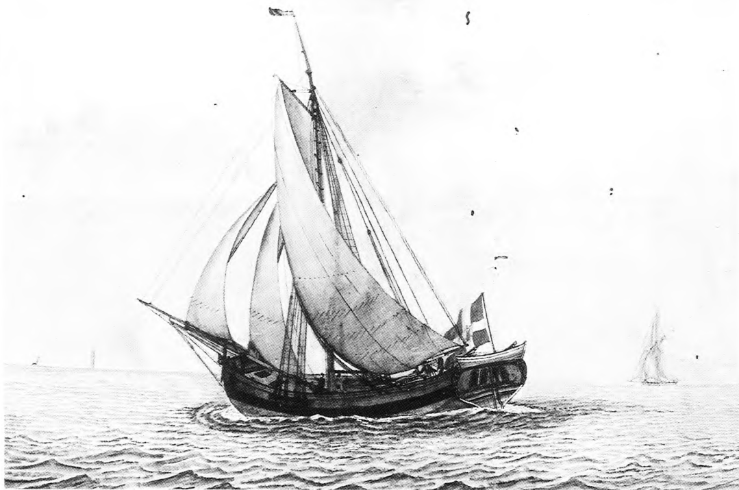
Om den gode jagt "Attenhundrede" - bygget i Marstal i dette år - nogensinde har været i Skælskør eller Bisserup, må stå hen i det uvisse. Men den kan bruges som eksempel på de fartøjer, der anløb de to havne på denne tid. Skibsportrætter som dette anses normalt for at være særdeles pålidelige m.h.t. skrog og indretning. Men man kan stille spørgsmålstegn ved, om jagten virkelig har haft så stort et spring, dvs. så krum en overflade, som det fremgår af billedet. Handels- og Søfartsmuseet på Kronborg, SR-982:68.

tet bliver taget i betragtning. 73 Godsforvalterne synes nemlig at have haft en udpræget tilbøjelighed til at afsætte det dårligste korn til de lokale købmænd. Generelt kan man derfor ikke sige, at købmændene i første halvdel af 1790'erne gav dårligere priser end Ærøskipperne. Noget andet er, at købmændenes gode priser muligvis kan være fremkaldt af den konkurrence, som Ærøskipperne påførte dem. For perioden efter 1795 foreligger der et forholdsvis stort materiale til belysning af Ærøskippernes priser. De fleste af Ærøboernes opkøb fandt sted i april ( naar Søen aabner ), og det er derfor naturligt at sammenholde disse forårspriser med de sjællandske kapitelstakster. Det viser sig, at Ærøskipperne ofte var tilbøjelige til at betale 1–2 mk. over kapitelstakst;