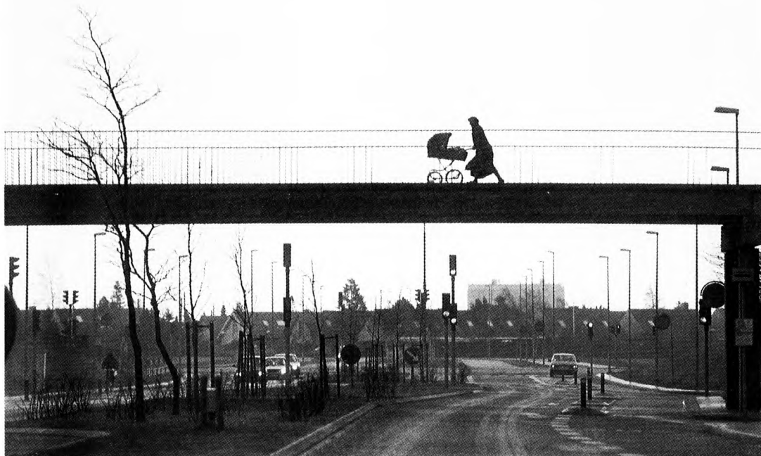
De moderne kvarterer efter 1960 har fælles rum og fælles arealer som aldrig tidligere, men det fælles kan ikke bruges til noget, er ikke til mødet mellem mennesker, men til individuel transport fra bolig til arbejde, indkøb og fritid i form af store vejanlæg, ramper, parkeringspladser, gangbroer, stier og omkørsler. Her eksemplificeret ved kvarterets rum i Avedøre Stationsby 1993.