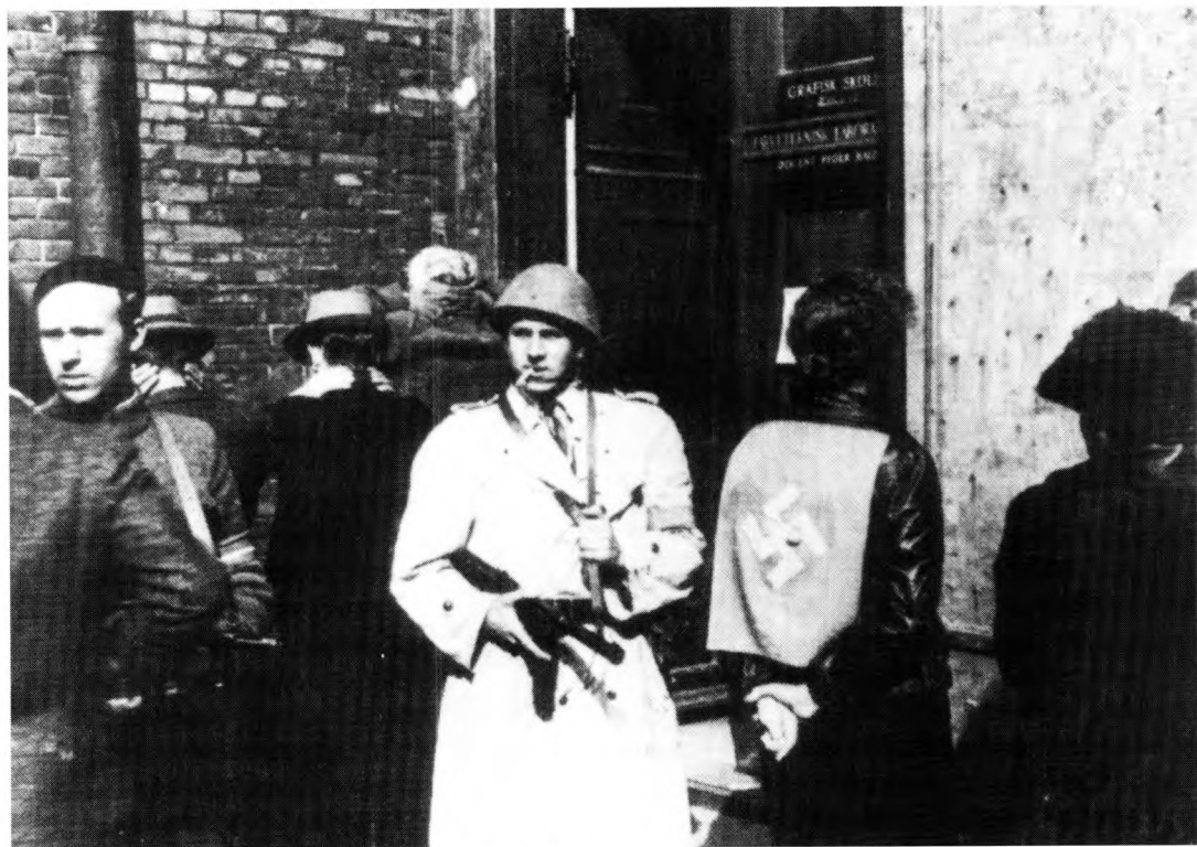
4. Frihedskæmpere med pige ved Charlottenborg.

I deres hunger efter billeder tog massemedierne tilflugt til en række kunstgreb for at sikre sig frihedskæmperbil-