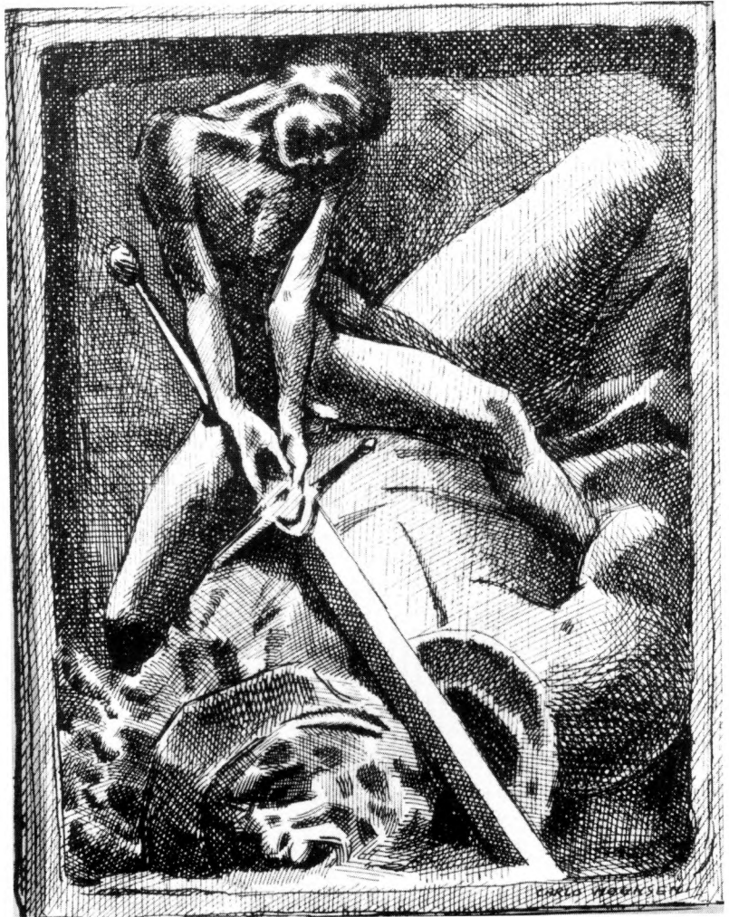
12. »David og Goliath«. Professor Utzon Frank. Foto: Det kongelige Bibliotek.

med den første videnskabelige fremstilling af modstandsbevægelsen og den store opmærksomhed, der blev disse værker til del, kan have spillet ind. 39 Nogle frihedskæmpere ville have andel i den ære og status, der lå i at være en af dem, som havde været aktivt med. Medlemslister og tilgangsfortegnelser blev en bestanddel af det trykte stof i veteranbladene. Efterlysninger af gamle kammerater og oplysninger om tidligere illegale grupper ligeledes. De trådte mere og mere offentligt frem som veteraner gennem deres foreninger og blade, og de begyndte at optræde som pressionsgruppe og opinionsdannere i