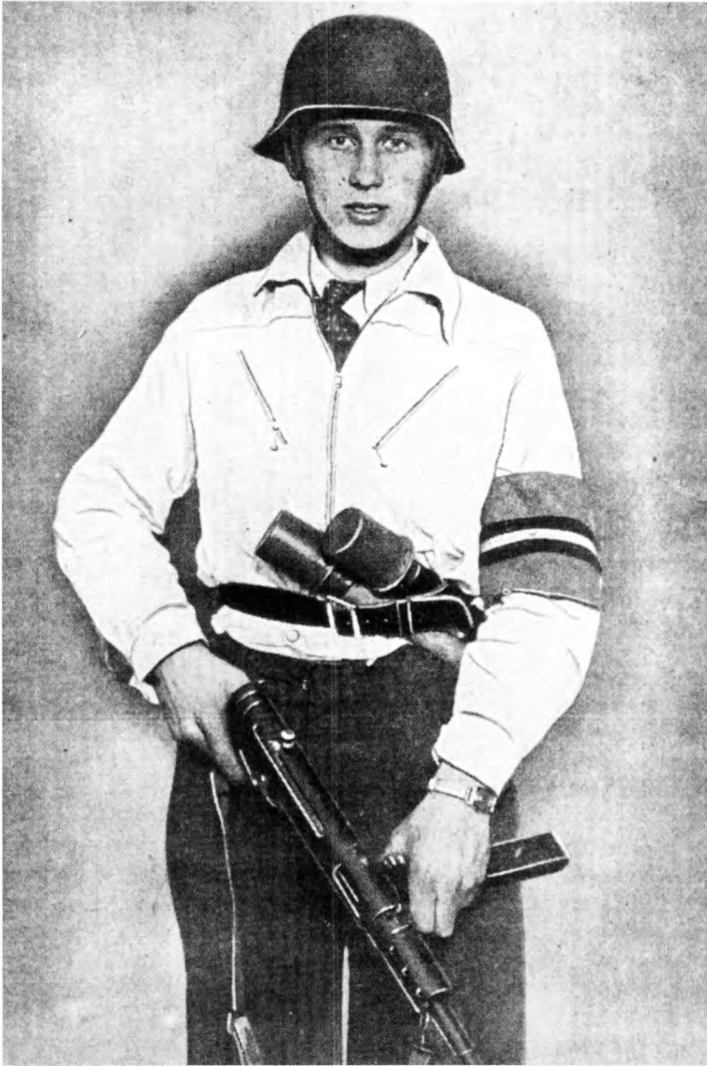
7. Forsideillustration til Danmarks Frihedskamp .

der straks gik i begrebet frihedskæmper (ill. 6). Frihedskampen havde været civilisternes oprør, og alligevel skulle de i majdagene 1945 absolut militariseres. Armbindet var tilsyneladende ikke nok for offentligheden, i hvert fald ikke hvis der skulle komme brugbare »frihedskæmperbilleder« ud af det. Offentligheden ville åbenbart have noget bestemt, og det fik den sandelig. Der skulle mere