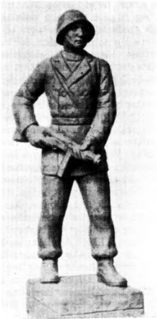
11. Frit Danmark : Uheldige forslag til frihedskæmper-monumenter.

element, hvilket langt er at foretrække for uniformerede og bevæbnede krigere. Redaktionen af Frit Danmark prøvede at mane til at undgå de værste monumentale udskejelser m.h.t. frihedskæmperbilleder. Den opfordrede i efteråret 1945 til dannelsen af en kunstnerisk komite til at vejlede i spørgsmålet og trykte eksempler på det, der burde undgås (ill. 11). 34 Stort set synes den bestræbelse at være lykkedes, hvad enten komiteen blev en realitet eller ej. Over-