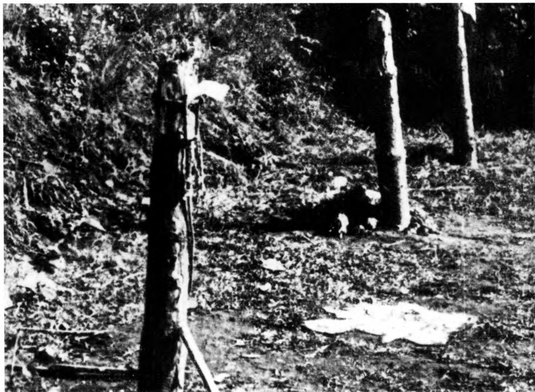
9. Ryvangens pæle.

sjælelige forstyrrelser resten af livet. Uden for »frihedskæmperbilledernes« søgelys. De var dog i live, mens de, som kom hjem i kister, nok kort optrådte i massemedierne før derefter at glide ud i ubemærketheden. 29 Der skal noget særligt til, hvis fotos af kister, selv med helte, skal vække varigere interesse.