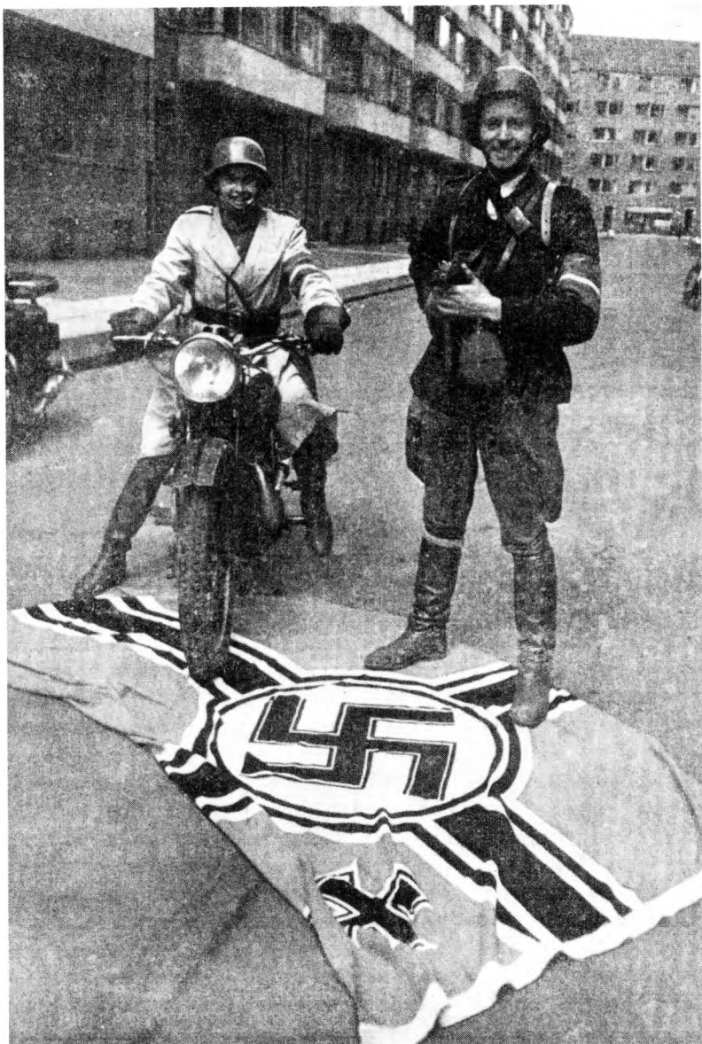
6. Frihedskæmpere ved erobret naziflag.

majdagene blev fotograferet i engelsk uniform skulder ved skulder, smilende af umiddelbar, uforstilt glæde. 21 De skulle danne vagt i Special Forces' hovedkvarter i København. Der var altså en særlig grund til uniformeringen. Måske virker billedet så positivt, fordi Horwitzs ledsagende erindringer efterlader indtrykket af en meget sympatisk mand (ill. 5).