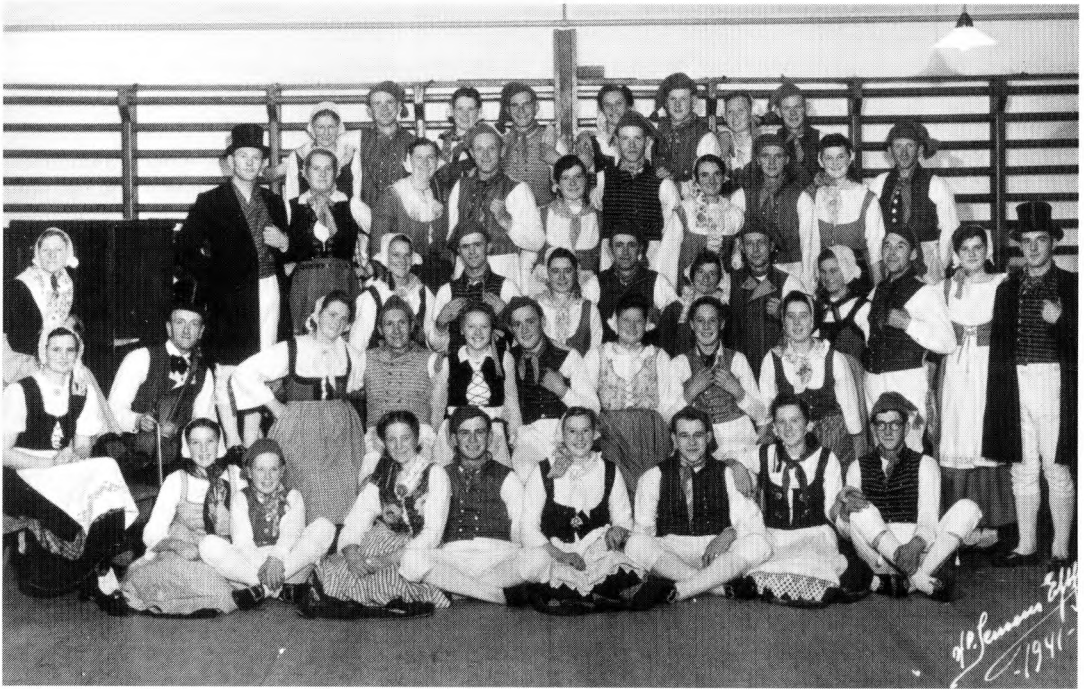
Folkedans var også en del af aktiviteterne i mange idrætsforeninger, om end der i mellemkrigsårene også helst skulle stå mere moderne dans på programmet, i alt fald ved festerne. Her er det folkedansere fra Trelde Idrætsforening, der i 1941 er stillet op til fotografering.

nere på elementer fra bykulturen. I protokollen fra Gårslev Idrætsforening mellem Fredericia og Vejle kan man i 1948 læse følgende klare tegn på udhuling af bondekulturen: