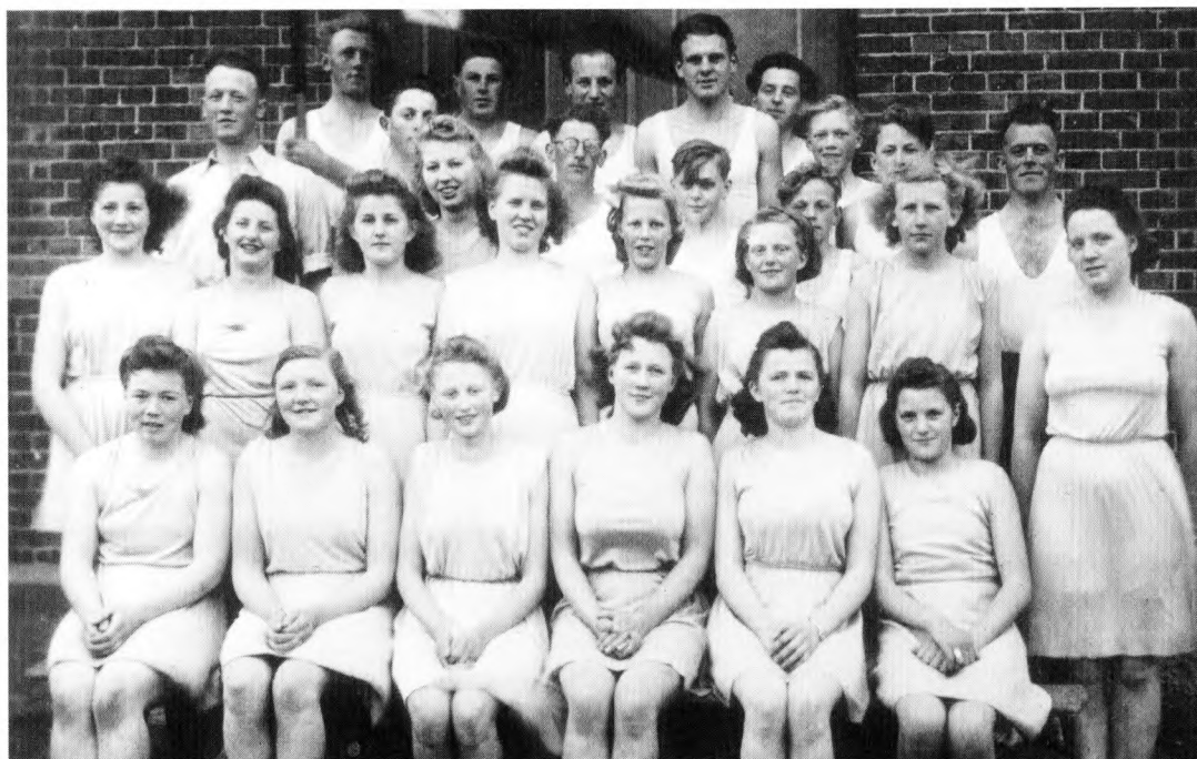
Fra 1936 tog man i Trelde Gymnastik- og Idrætsforening også håndbold på programmet, og det satte nyt liv i foreningen og gav øget tilslutning også til gymnastikken, som det fremgår af dette billede fra gymnastikopvisning i Trelde forsamlingshus i 1943.

hele taget med de øvrige landsbyer på egnen. Håndbolden var et nyt frist pust, der bidrog til at bringe Trelde ud af sin tornerosesøvn. Sportsfesterne rundt omkring på egnen sommeren igennem markerede en helt ny situation i forhold til den traditionelle lokale gymnastikopvisning i forsamlingshuset sidst på vinteren. Om det så er hygiejnen i forbindelse med idrætten, synes den at have haft gavn af håndbolden: Efter træning, som i starten foregår ved Strandgården, kunne man bade i fjorden.