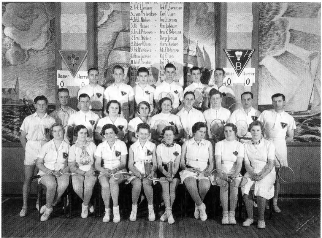
En sportsgren, der blev taget op i mange idrætsforeninger i mellemkrigsårene, var badminton. Her er Espergærde Idrætsforenings badmintonspillere fotograferet i salen på Hotel Gefion.

Til trods for at Gudbjerg er beliggende midt i det traditionelt set »vakte« sydfynske område og på trods af forbindelser til højskoleverdenen, har dette – som i Vejen hvor Askov Højskole og Sportsforeningen fra starten arbejdede tæt sammen 33 – aldrig forhindret, at den sportslige side af idrætten har været højt prioriteret siden introduktionen af sport i 1930'erne, samtidig med