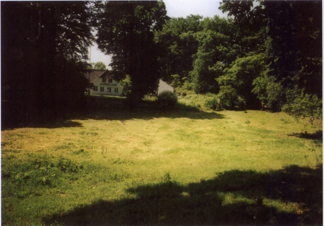
Pavillonen Hvaldund, smukt beliggende i Elbodalen vest for Fredericia, var i en periode fra midt i 1930'erne til først i 1950'erne en hård konkurrent til Herslev Forsamlingshus, når idrætsforeningen skulle finde et sted at afholde bal. Den blev også stedet for en økonomisk øretæve, som nær havde sat foreningen ud af spillet.

trerer man sig herefter ligeligt om håndbold og gymnastik, medens man i Herslev og Syvsten kort ind i 1940'erne synes at være blevet mest ambitiøs på fodboldspillets vegne, som til gengæld ikke spiller nogen rolle i Gudbjerg. Det afgørende er imidlertid, at der i alle tilfælde satses på mere end gymnastik alene, nemlig både gymnastik og boldspil, dvs. sport. Om noget modsætningsforhold mellem disse to idrætsformer kan man ikke tale. Snarere supplerer de hinanden. Til gengæld er det ganske tydeligt, at det er takket være boldspillet, in casu: håndbold og fodbold, at der kommer liv i idrætten i 1930'erne. Det er med andre ord sporten, som sætter fart i idrætten, medens gymnastikken alene ikke er i stand hertil. Til gengæld