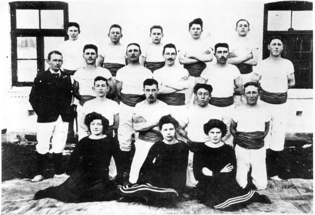
At den svenske gymnastik var en måde at udtrykke sin identitet og selvforståelse på, lyser ud af dette billede af et gymnastikhold fra Svysten omkring 1911. Både påklædning, opstilling og mimik signalerer her et hold selvbevidste gymnaster fotograferet i forbindelse med en gymnastikopvisning.

danske bondekultur. Dette er ikke et ganske uproblematisk forehavende. Det er således vigtigt at holde sig for øje, om man her primært tænker på produktionsmåden eller på de kulturelle selvforståelser, der knytter sig hertil.