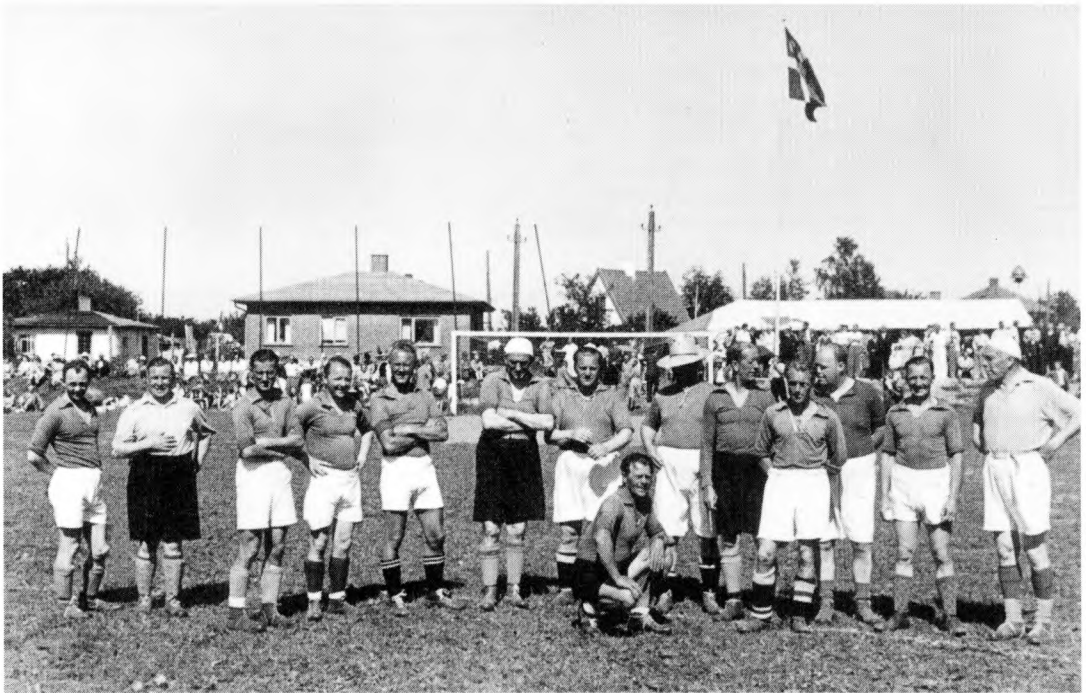
Sammenholdet under krigen smittede også af på idrætsforeningerne. I Espergærde sluttede byens borgere og landliggerne således op omkring Espergærde Idrætsforenings arbejde. Et udslag heraf blev »landliggerkampene«. Ved den første landliggerkamp udfordrede idrætsforeningen de gamle landligger-oldboys til kamp om 11 gode cigarer – en sjælden vare på det tidspunkt. Arrangementet blev en stor succes med 1.500 tilskuere. Denne kamp fulgtes af flere lignende dystre, som alle blev sommerens store festforestillinger.

foreningen, men til gengæld blev Espergærde Badmintonklub oprettet, ligesom Idrætsforeningen under 2. verdenskrig også lavede en badmintonafdeling; de blev i 1945 blev sluttet sammen som en selvstændig badmintonafdeling inden for EIF. 39