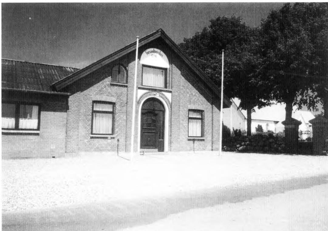
I den grundtvigske selvforståelse hørte aktiviteterne i forsamlingshuset og forkyndelsen i kirken nøje sammen. I Herslev opførte man da også i 1890 forsamlingshuset i umiddelbar nærhed af kirken. Forsamlingshuset i Herslev har gennem generationer været rammen om en væsentlig del af sognets sociale og kulturelle liv. Foto: Troels Kayser Nielsen 1994.

dansk mobiliseringsproces i 1800-tallet. Modsat Sverige, som indarbejdede »folkrörelserna« evolutionært i embedsmændsstaten, modsat Finland, hvor moderniseringen skete fra oven og blev et statsanliggende, og modsat Norge, hvor den alternative modernisering erobrede staten nedefra, opstod der i Danmark et parløb: ved siden af den sfære, som blev administreret af statslige embedsmænd, opstod der først i 1800-tallet en alternativ sfære, der organiserede et nyt samfund i form af først religiøse bevægelser, senere andels- og højskolebevægelse. 4 Om nogen organisk sammenhængende fællesdansk kultur var der således ikke tale. Snarere holdt de to fløje hinanden i skak.