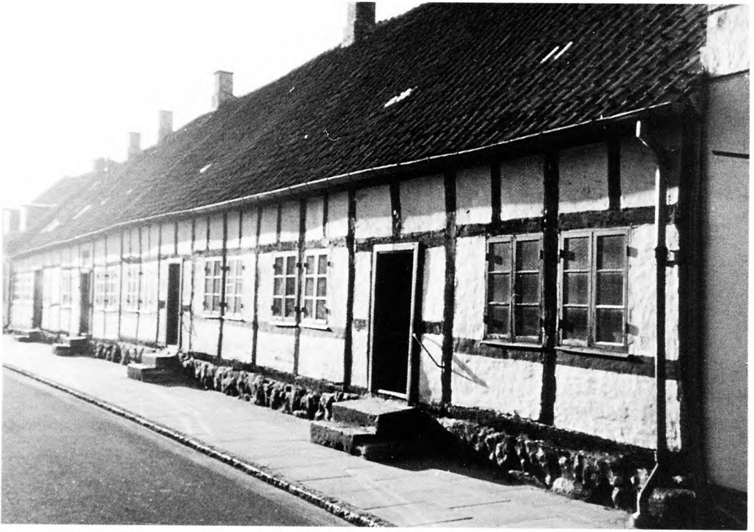
Foto af Fattighuset i Saksbøbing og af Juniors Hospital, ca. 1935.