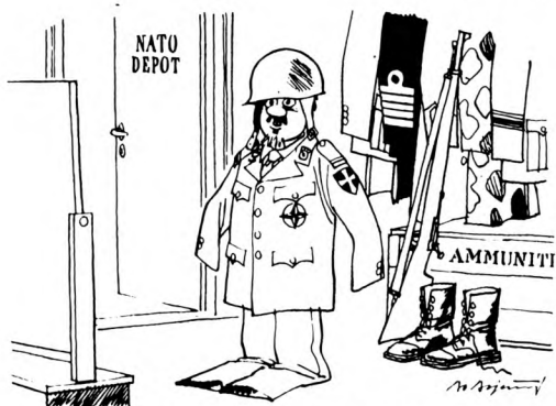
Stor i slaget

Uden karikaturen går det slet ikke! En lille mand i stort tøj – tegnet af Bo Bojesen som kommentar til en NATO-debat i Folketinget i oktober 1980 (Bo Bojesen: Årets tegninger fra Politiken 1981).