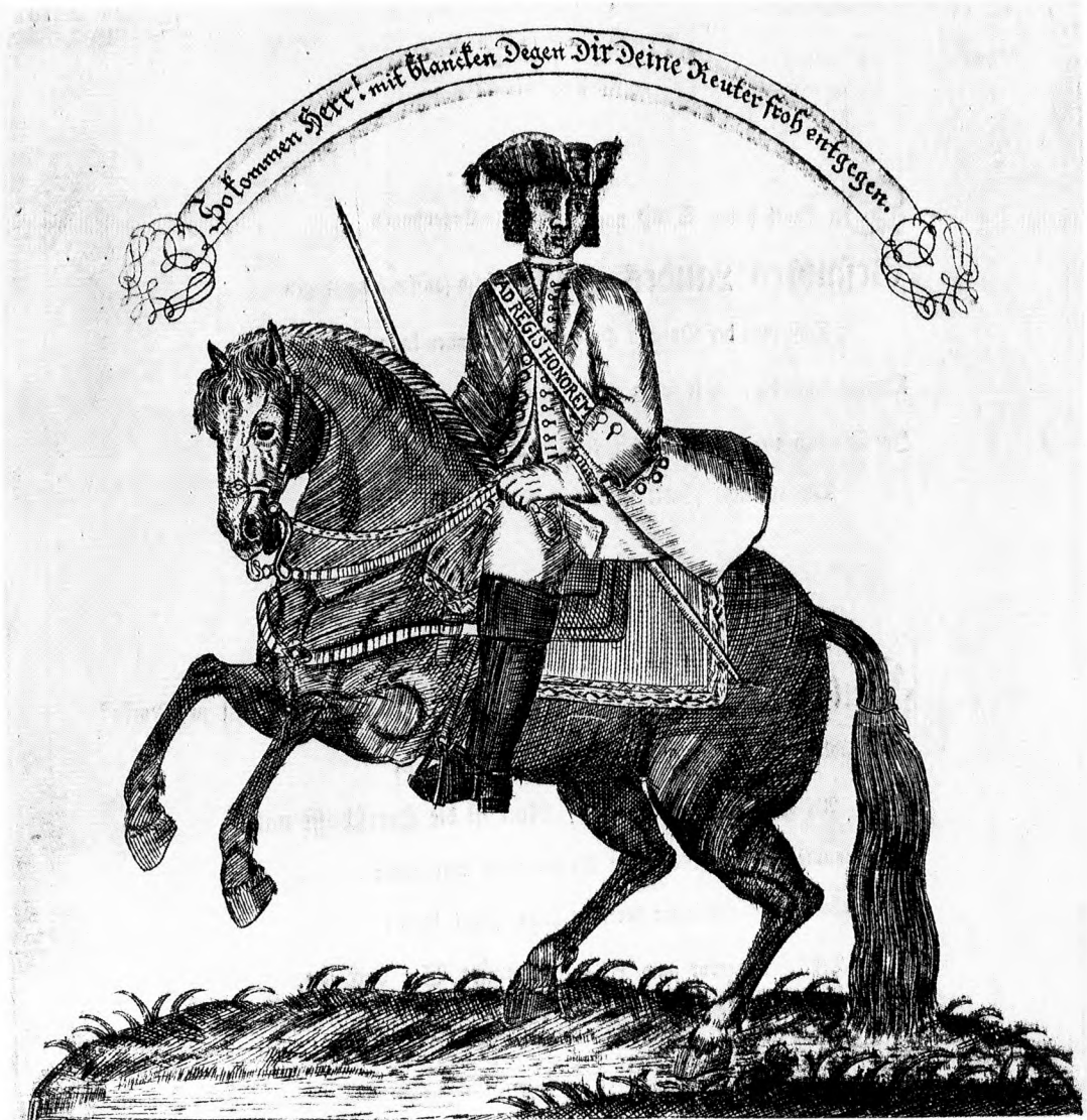
I oktober 1745 søgte købmandsstanden i Flensborg at bringe sig fordelagtigt i erindring hos landsfaderen – Christian VI – ved at overrække majestæten et hyldestdigt. Digtet var ledsaget af flere stik, bl.a. denne gengivelse af en rytter fra Flensborgs borgergarde til hest – et fornemt selskab, som blev rekrutteret fra byens velhavende handelsstand. (Rigsarkivet. Kommercekollegiet 1735–71. Tyske sekretariat nr. 356).

fet. Ovenikøbet overhørte byen Kommercekollegiets anmodning om at få forelagt tal-mæssig dokumentation for de skadelige virkninger af kommerceforordningen. Byen nøjedes med udokumenterede påstande, bl.a. på vers, og byen modsagde endog respektløst de allerhøjeste afgørelser på tryk. I juni 1748